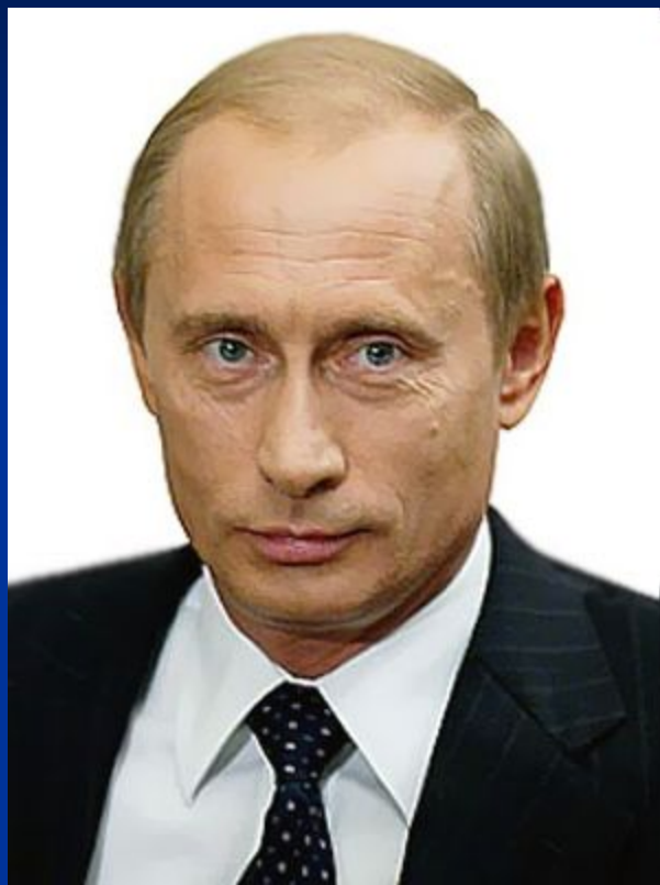
Путин В. В.