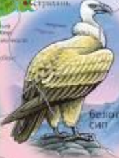
белый аловый сип