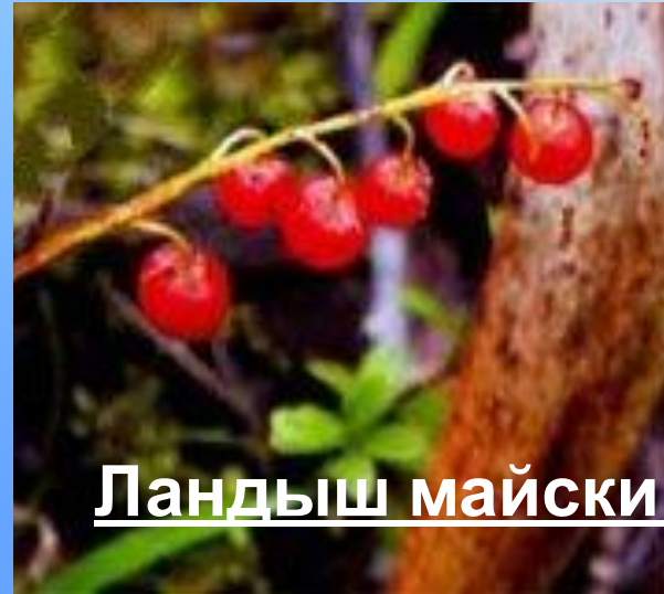
Ландыш майский 2гр