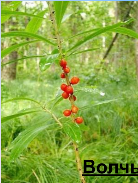
Волчье лыко 3 гр