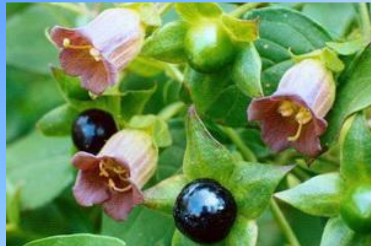
Красавка (беладонна) 4 гр