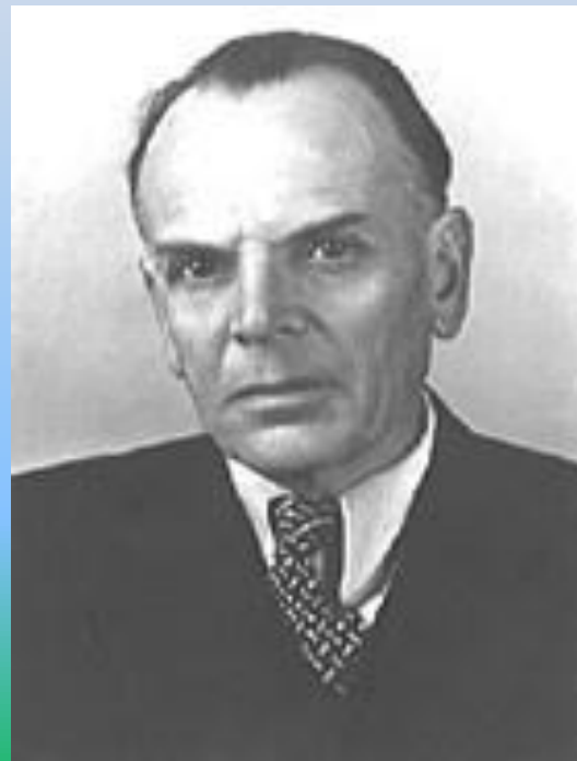
Константина Георгиевича Паустовского (1892-1968)

“Неужели мы должны любить свою землю за то, что она богата, что она дает обильные урожаи и природные ее силы можно использовать для нашего благосостояния! Не только за это мы любим родные места. Мы любим их еще за то, что даже небогатые, они для нас прекрасны».