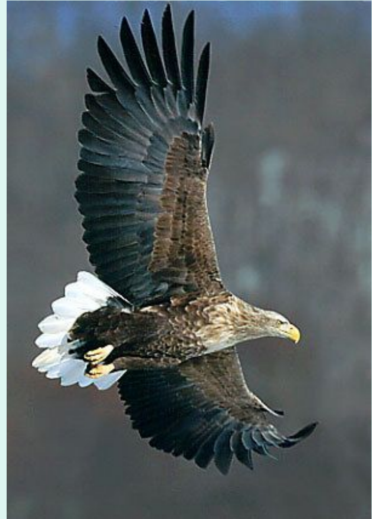
Орлан – белохвост. ↑ ←Краснокнижный черный аист.