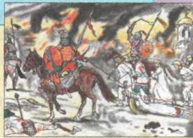
Набег на русское селение.