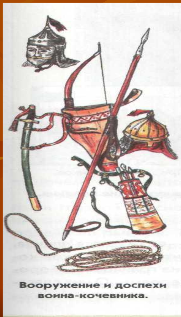
Вооружение и доспехи воина-кочевника.

Со времён Древней Руси жителям нашей страны часто приходилось защищать родную землю от врагов