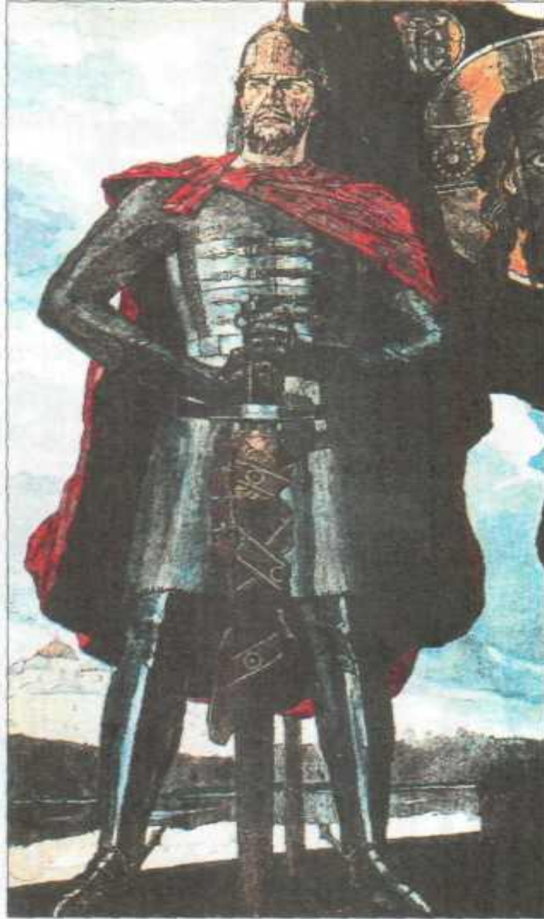
П. Корин. Александр Невский.