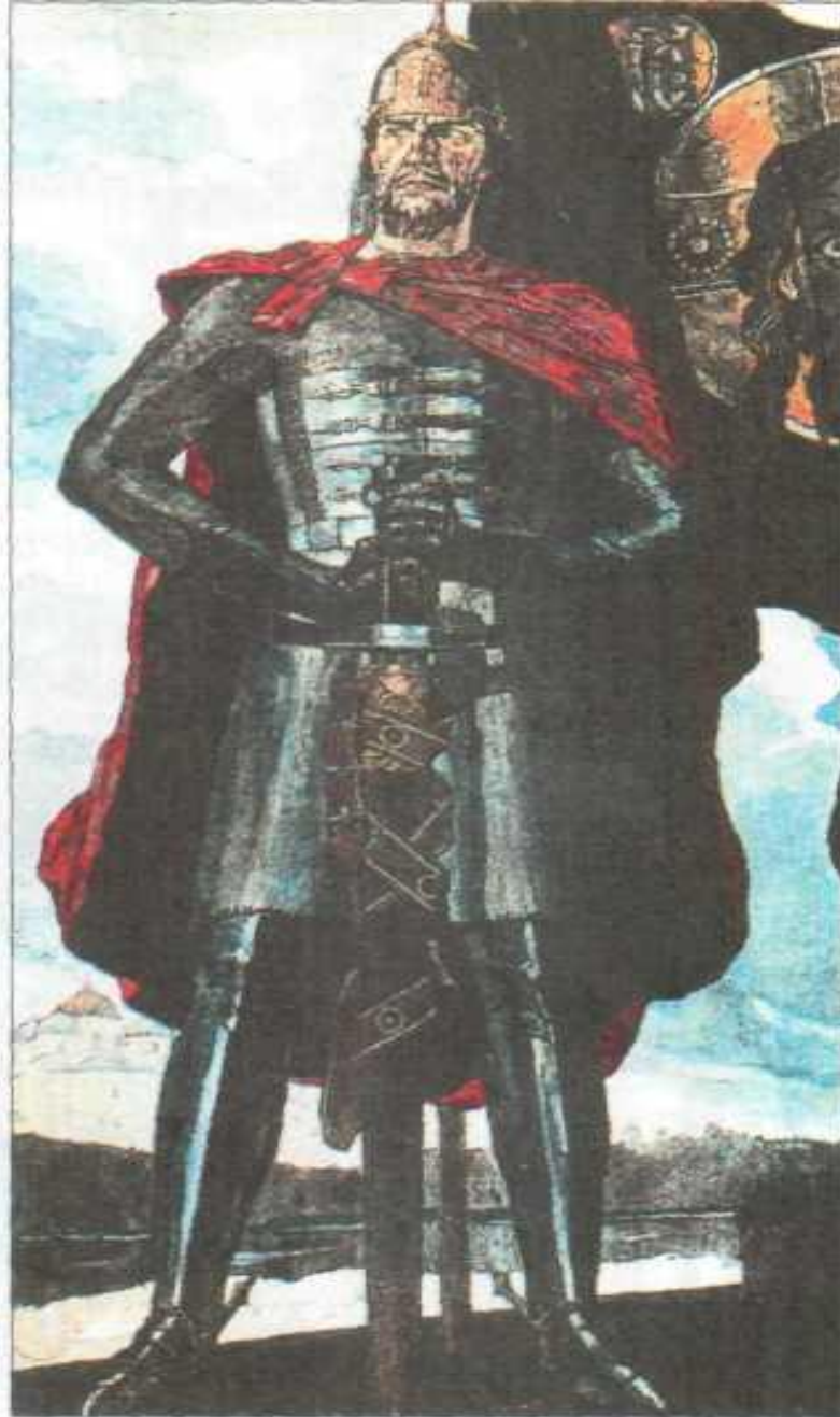
П. Корин. Александр Невский.