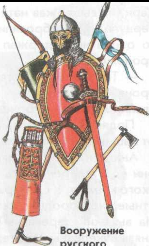
Вооружение русского дружинника.