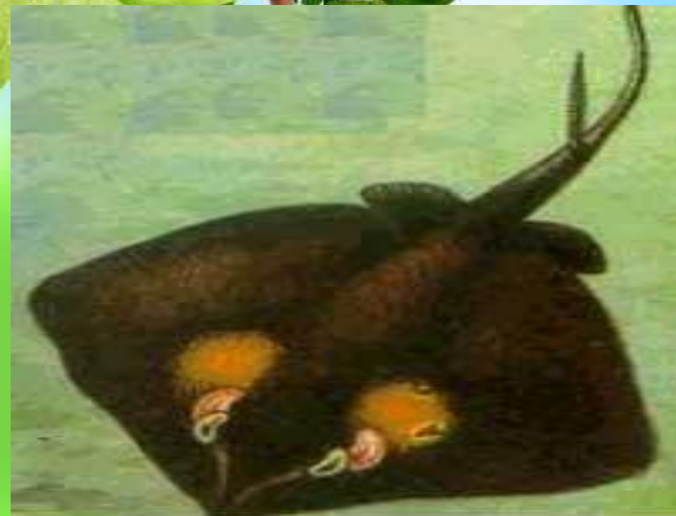
морской кот (Dasyatis pastinaca)

Для многих животных хвост единственное оружие. В Черном море обитает интересное существо – скат-хвостокол, или морской кот. Внешне скаты похожи на большую сковородку с ручкой-хвостом. У основания хвоста растет длинный, плоский, зазубренный по краям и острый, как шпага, шип. Подвергшийся нападению морской кот бешено бьет хвостом, нанося "шпагой" раны.