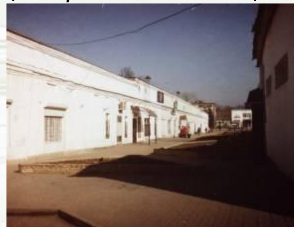
г) торговые ряды на центральной площади