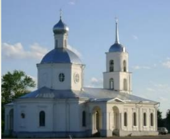
а) Троицкий собор

1. Среди достопримечательностей г.Острова отметьте самое древнее: