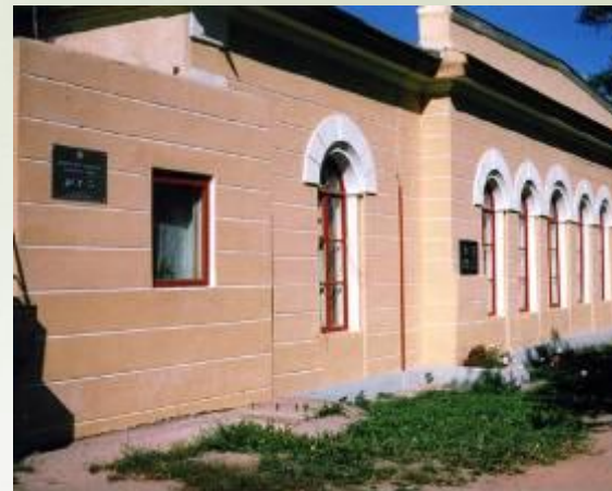
в) Ямская станция