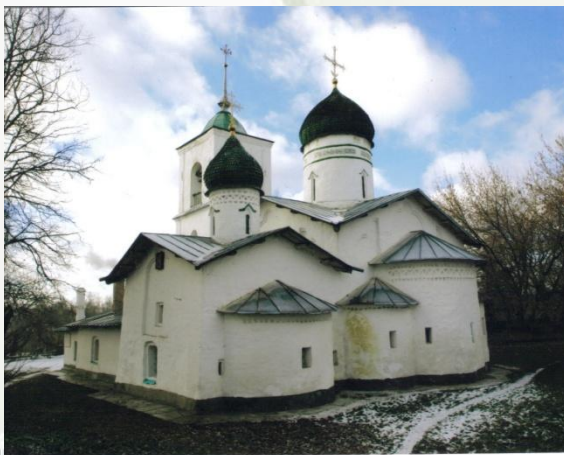
б) Никольский собор