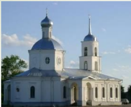
а) Троицкий собор

1. Среди достопримечательностей г.Острова отметьте самое древнее: