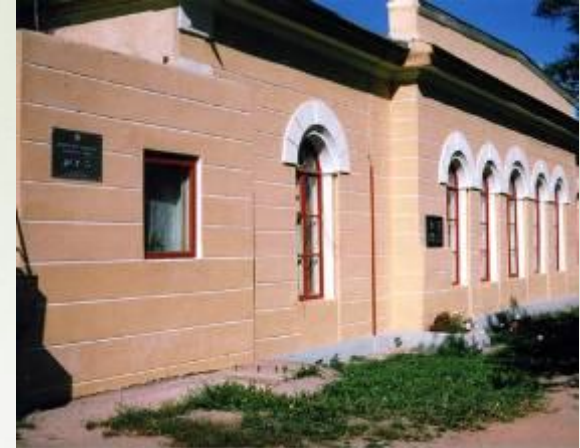
в) Ямская станция