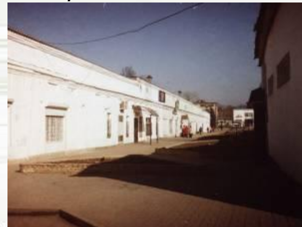
г) торговые ряды на центральной площади