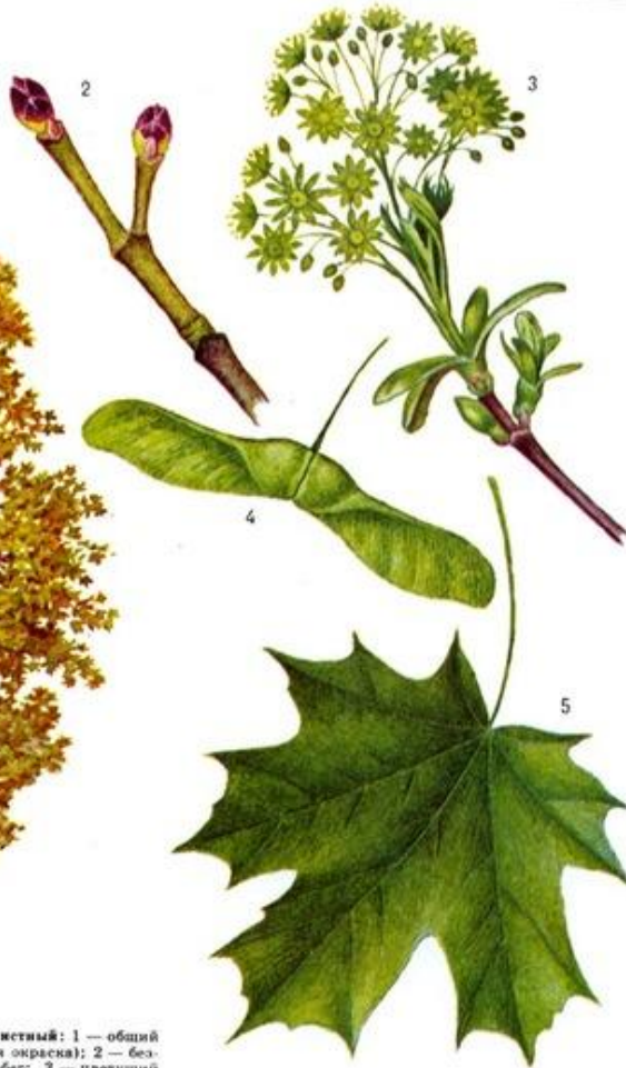
Клён остролистный: 1 — общий вид (осенняя окраска); 2 — безлистный побег; 3 — цветущий побег; 4 — крылатка; 5 — лист.