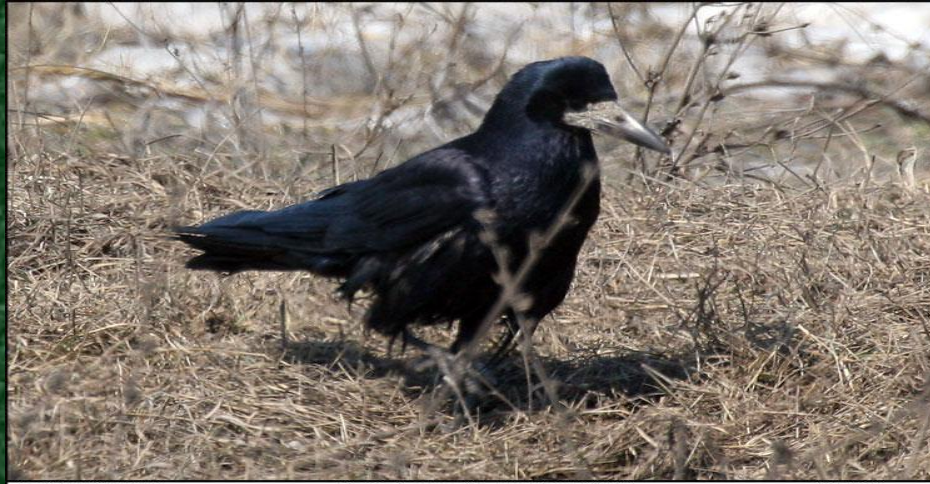
Грач ( Corvus frugilegus )

Россия, Рязанская обл., Шацкий р-н, 4.04.2006