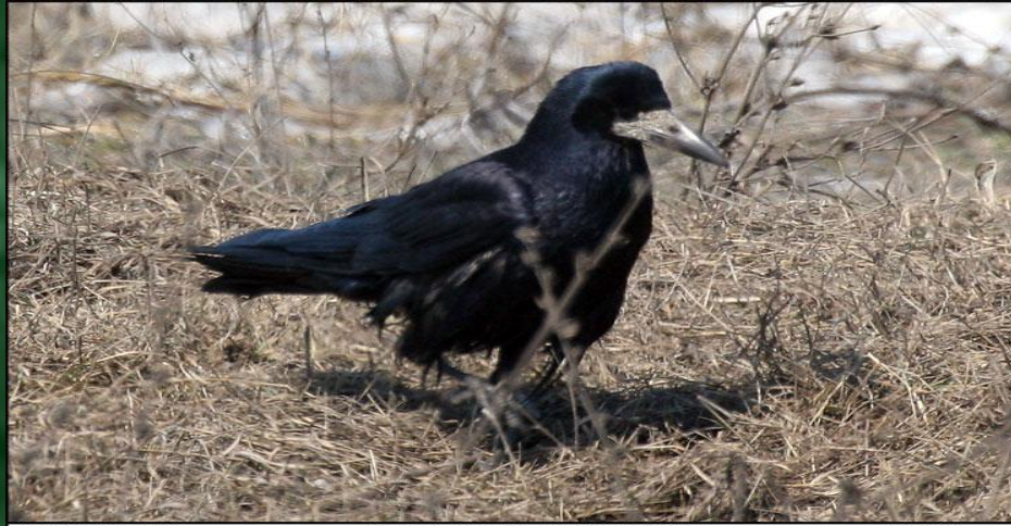
Грач ( Corvus frugilegus) Россия, Рязанская обл., Шацкий р-н, 4.04.2006

3). Что за весенняя чёрная птица Любит за плугом ходить и кормиться? Что за весенняя чёрная птица Прямо на трактор чуть не садится?