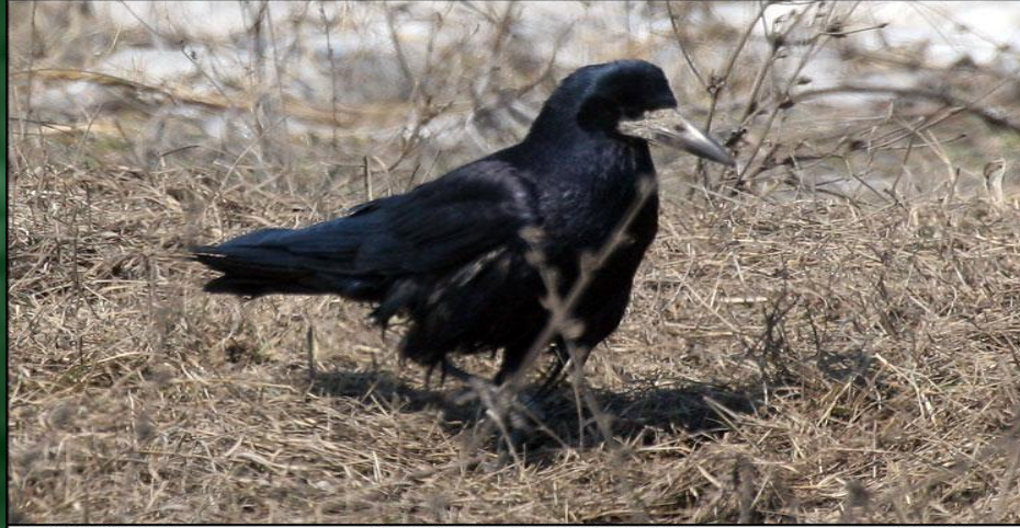
Грач ( Corvus frugilegus) Россия, Рязанская обл., Шацкий р-н, 4.04.2006

3). Что за весенняя чёрная птица Любит за плугом ходить и кормиться? Что за весенняя чёрная птица Прямо на трактор чуть не садится?