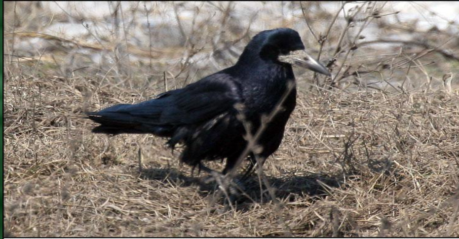
Грaч ( Corvus frugilegus) Россия, Рязанская обл., Шацкий р-н, 4.04.2006

3). Что за весенняя чёрная птица Любит за плугом ходить и кормиться? Что за весенняя чёрная птица Прямо на трактор чуть не садится?