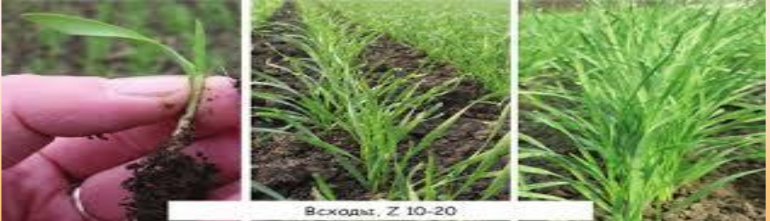
Всходы, Z 10-20