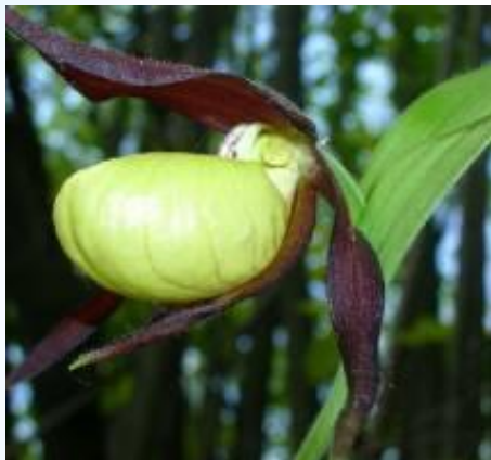
Венерин башмачок настоящий