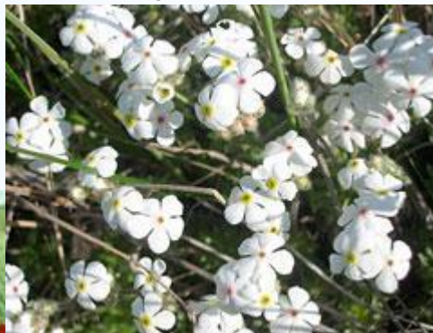
Проломник Козо- Полянского