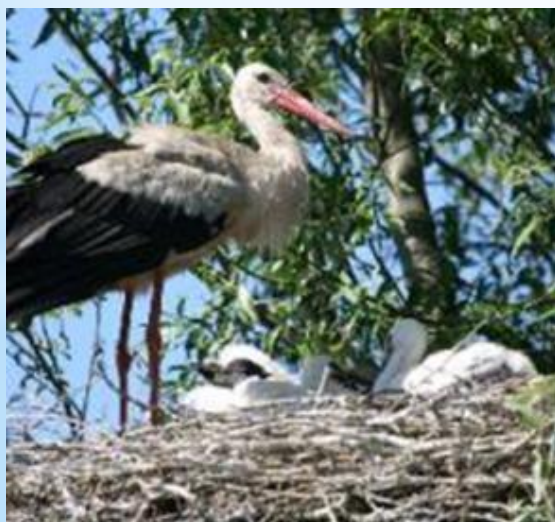
Белый аист с птенцами