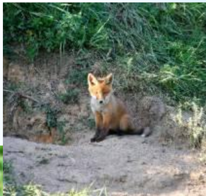
Лисенок у норы