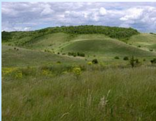
Участок Букреевы Бармы