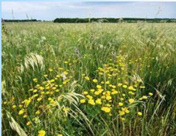
* Стрелецкий участок