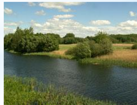
Участок Пойма Псла