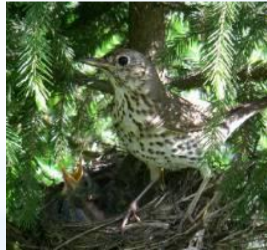
Певчий дрозд с птенцами