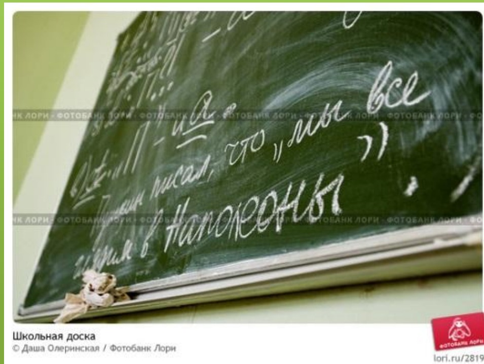
Школьная доска

Встаньте кому понравилось, кому что-то не понятно, поднимите руку, КОМУ НЕ ПОНРАВИЛОСЬ ПОНИМАЕМ УЧЕБНИК.