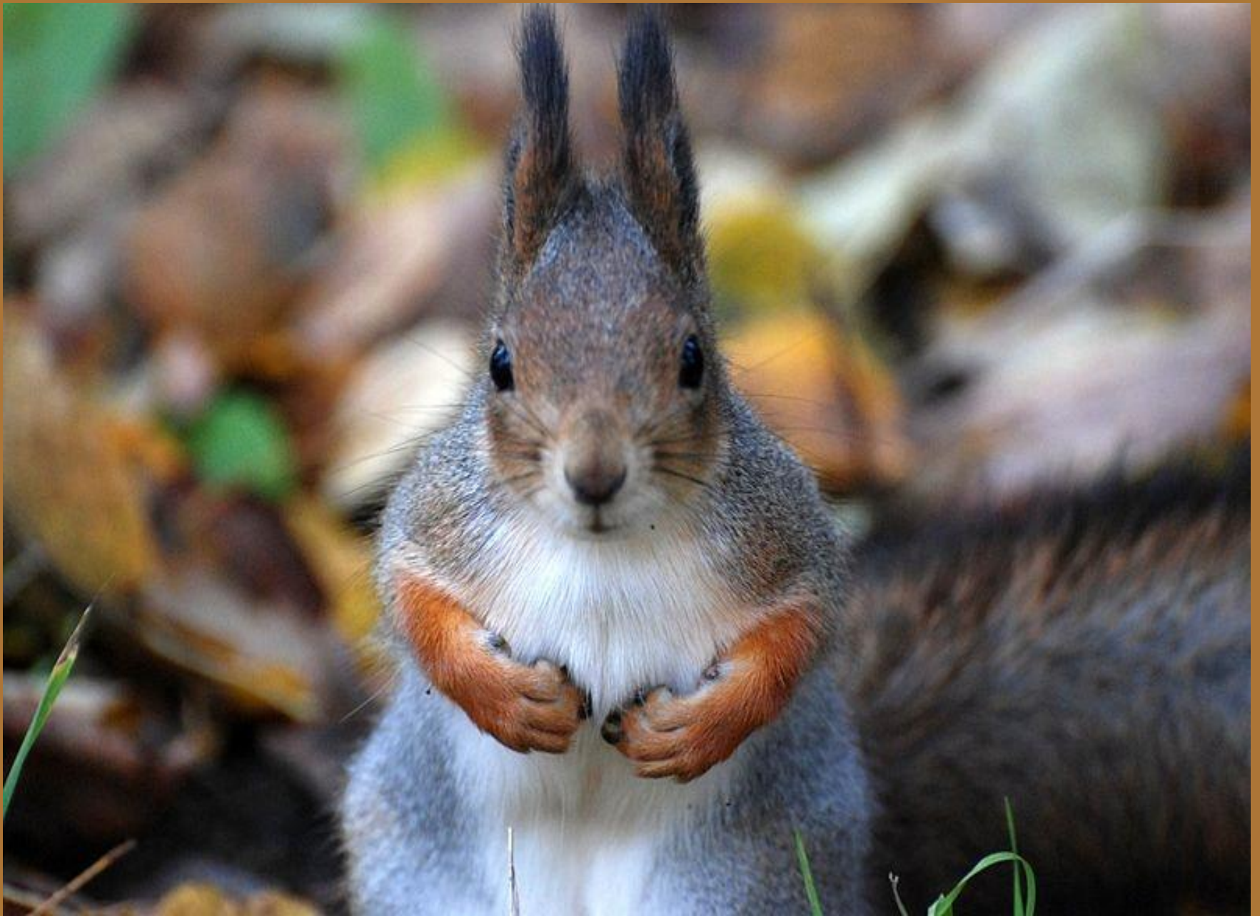
Белка, вид спереди.