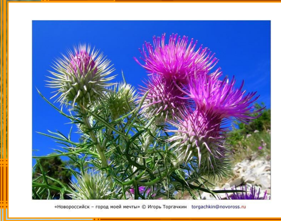
«Новороссийск – город моей мечты»