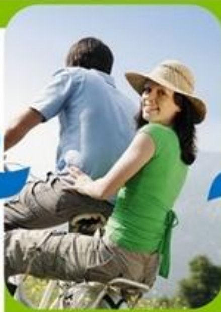
Активный образ жизни