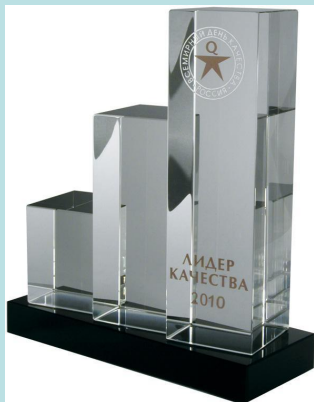
Приз «Лидер качества».