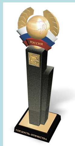
Приз «Гордость Отечества»