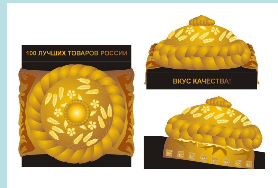
Приз «Вкус качества»

Почетный знак «ЗА ДОСТИЖЕНИЯ В ОБЛАСТИ КАЧЕСТВА»