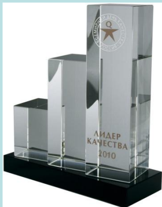
Приз «Лидер качества».