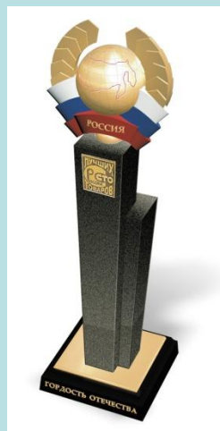
Приз «Гордость Отечества»