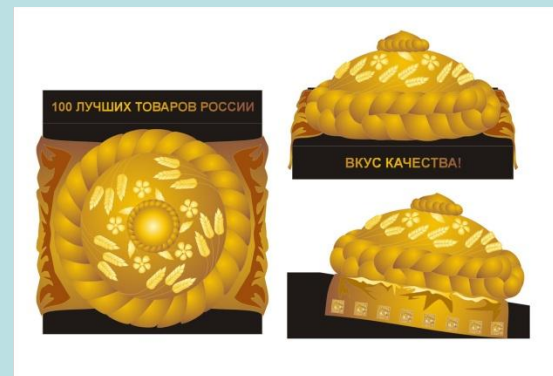
Приз «Вкус качества»

Почетный знак «ЗА ДОСТИЖЕНИЯ В ОБЛАСТИ КАЧЕСТВА»