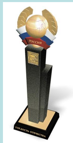
Приз «Гордость Отечества»