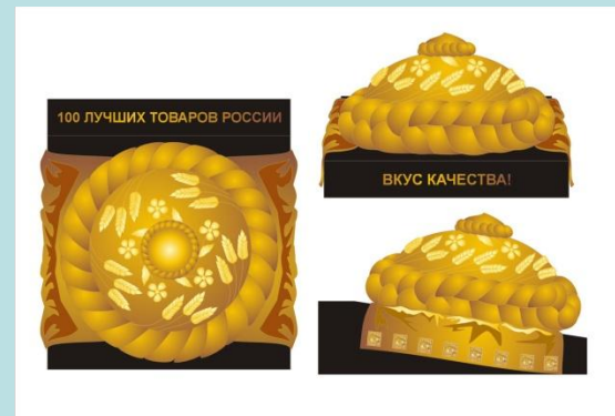
Приз «Вкус качества»

Почетный знак «ЗА ДОСТИЖЕНИЯ В ОБЛАСТИ КАЧЕСТВА»