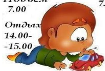
Отдых 14.00- -15.00