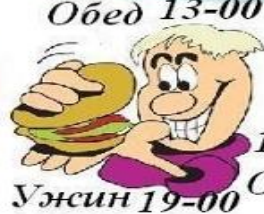
Ужин 19-00 Отдых 19-30