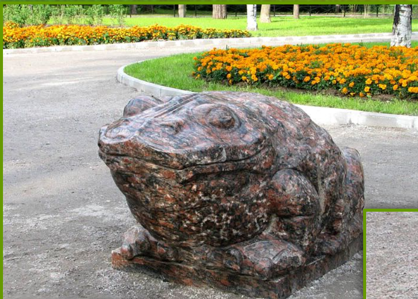
Знаменитая Рамбовская бурая жаба

Памятники жабам и жабятам в Рамбове (Ораниенбаум)