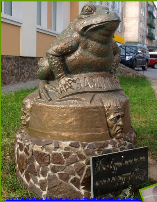
Дубно (Украина) парковая скульптура «Жаба»