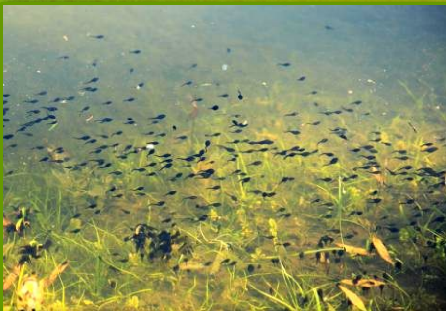
Головастики серой жабы

Они невелики по размерам, длина их не более 25-30 мм. Некоторое время держатся по берегам водоема, здесь кормятся, но в воду идут неохотно.