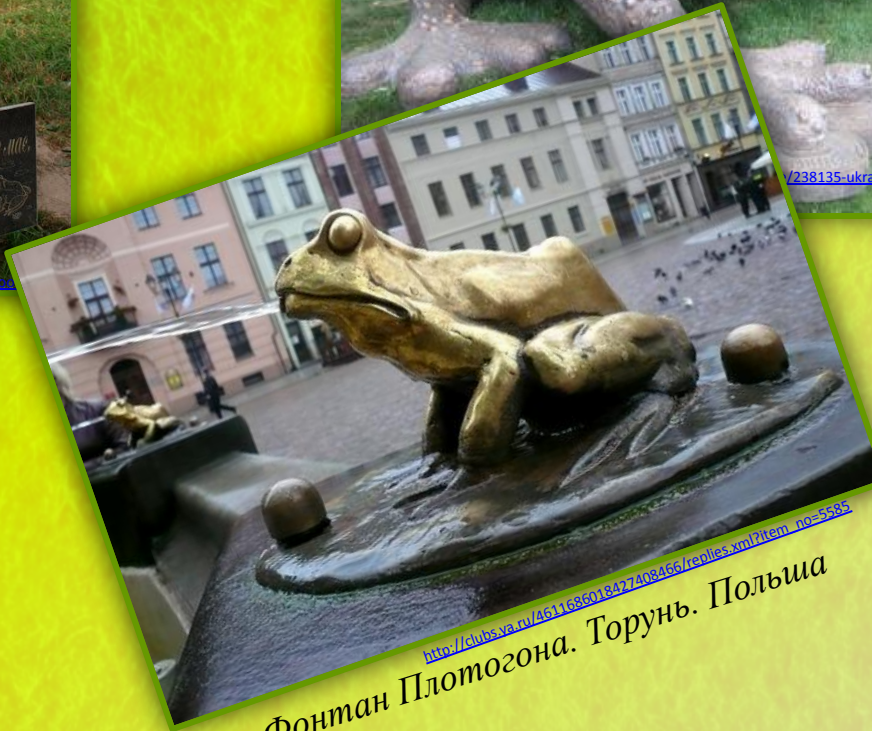
http://clubs.va.ru/4611686018427408466/replies.xml?item_no=5585 Фонтан Плотогона. Торунь. Польша

Внутри у неё ковш, туда надо бросать монетки. Когда вес в ковше достигнет критической точки, ковш перевернется и одарит деньгами какого-то счастливирика.