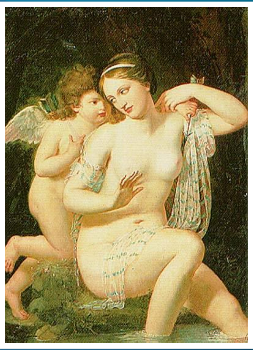
Венера и Амур – Куртейль Никола