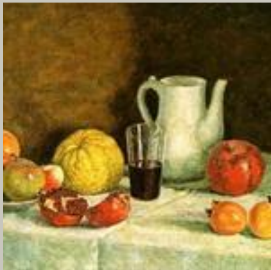
И. Машков Натюрморт" (1930)