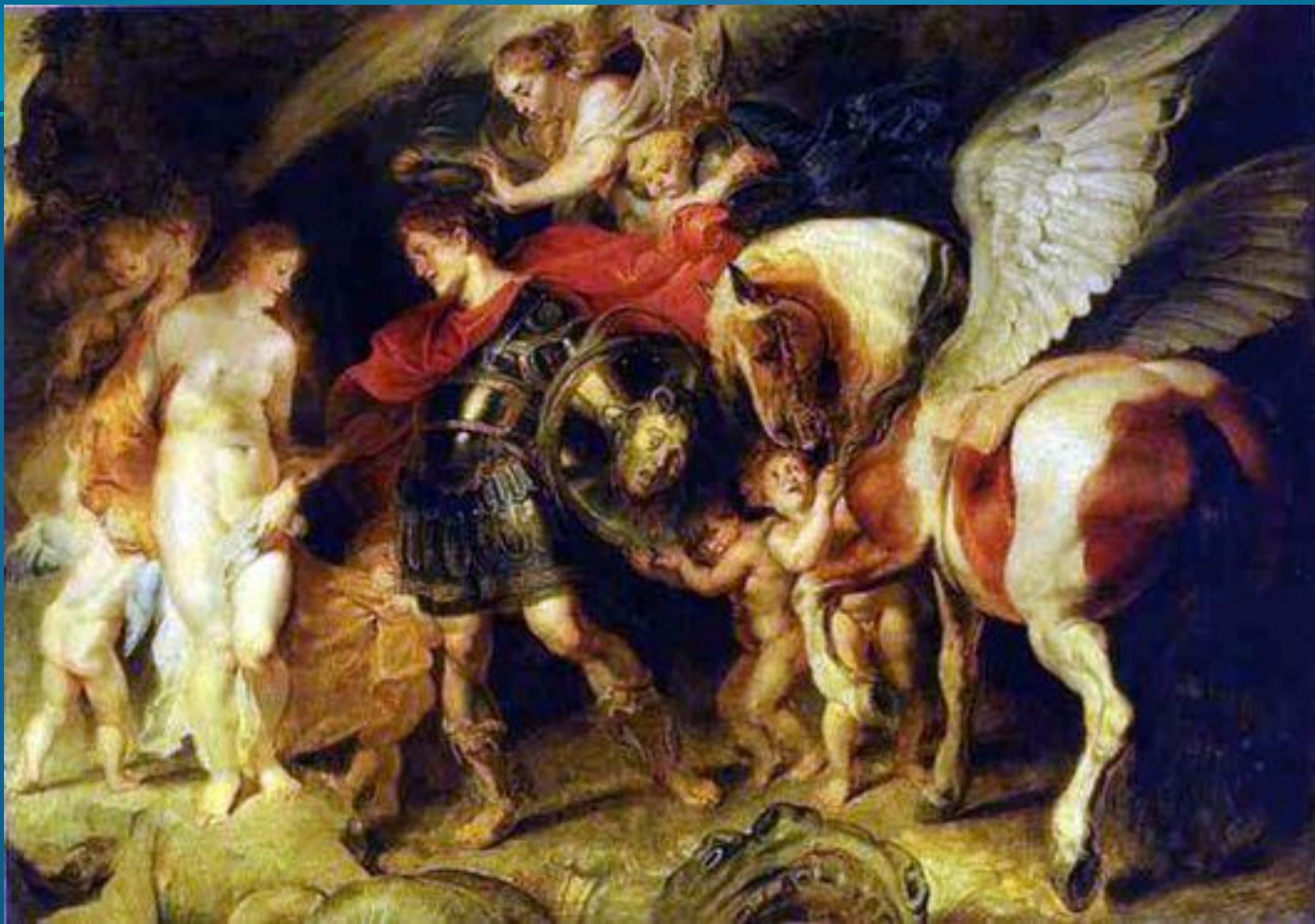
Персей и Андромеда - Рубенс Питер