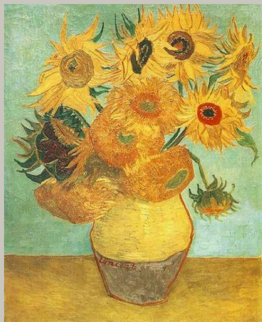
Подсолнухи. Винсент Ван Гог

Мы его составили, а потом рисуем – Вазочку с цветами, скатерть голубую, Книги, кисти, краски, даже бутерброд! О работе скажем – это натюрморт!