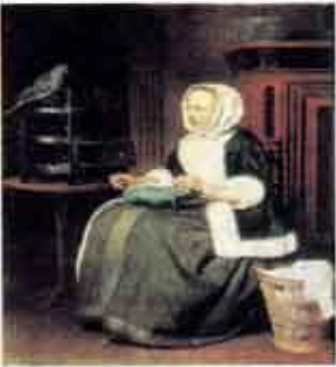
Г. Метсю. Девушка за работой.

Художники : А. Венецианов, П. Фёдоров, И.Репин, В. Маковский, Б. Кустодиев,