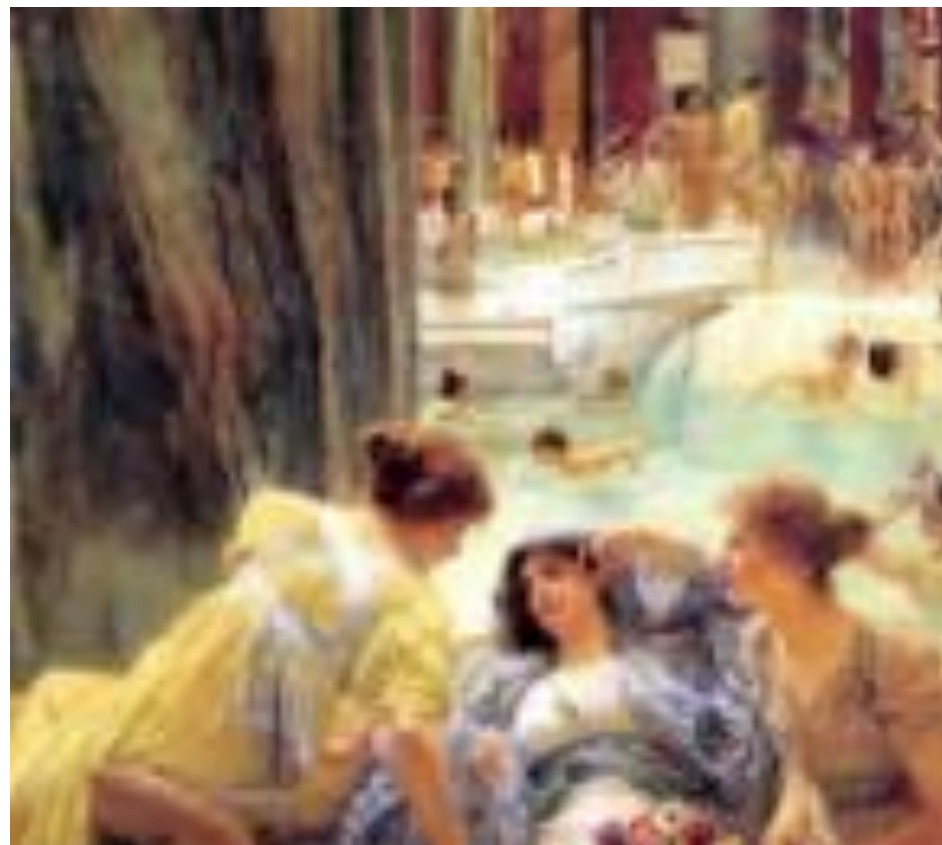
Тибулл Альма-Тадема Лоуренс