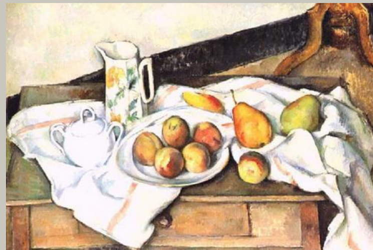
Поль Сезанн "Персики и груши" (1895)