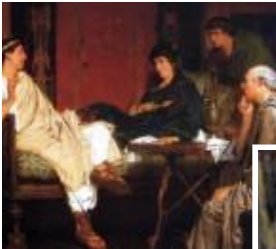
Ванны в Каракалле Альма-Тадема Лоуренс