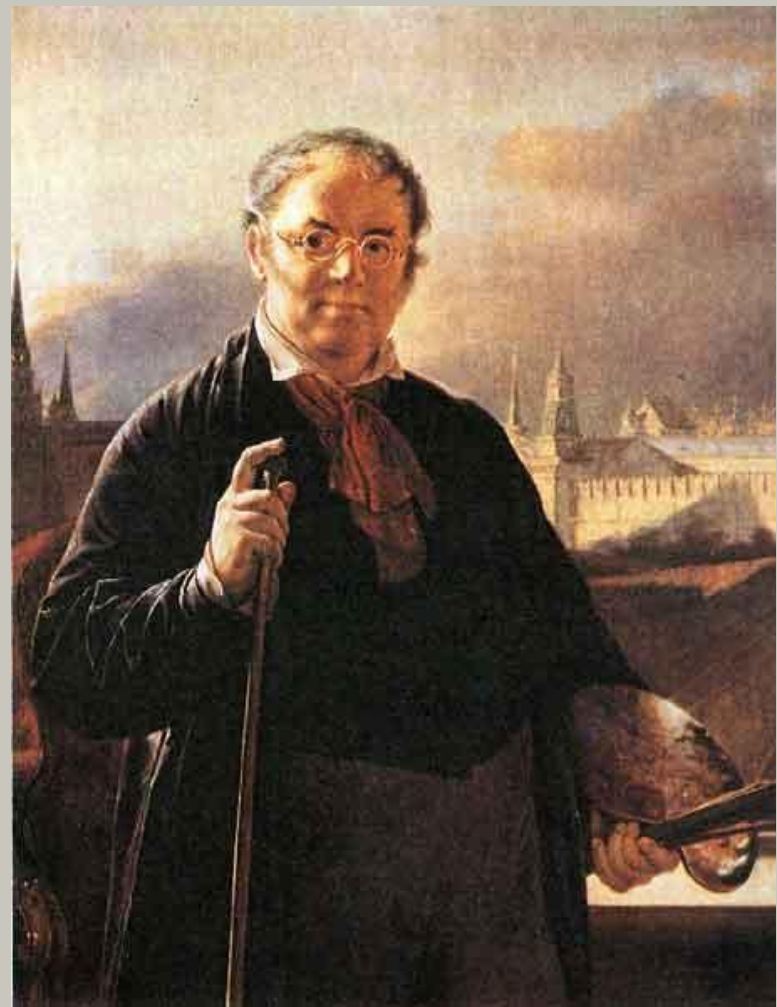
В.Тропинин. Автопортрет с палитрой и кистями на фоне окна с видом на Кремль.