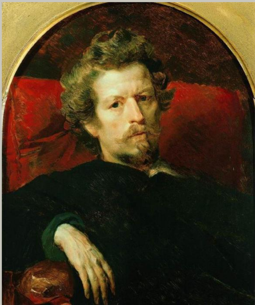
Автопортрет. Карл Брюллов