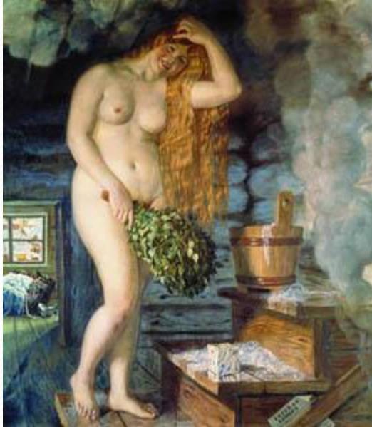
Русская Венера – Борис Кустодиев

Ню (фр. nu — сокращённое от фр. nudite — «нагота, обнажённость») — художественный жанр в скульптуре, живописи, фотографии и кинематографе, изображающий красоту и эстетику обнажённого человеческого тела.