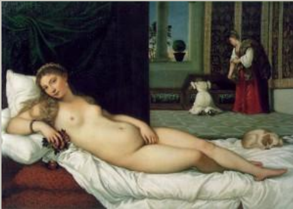
Тициан Вечеллио «Венера Урбинская»