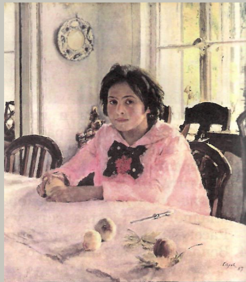
В. Серов. «Девочка с персиками».