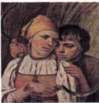
А. Венецианов. Жнецы