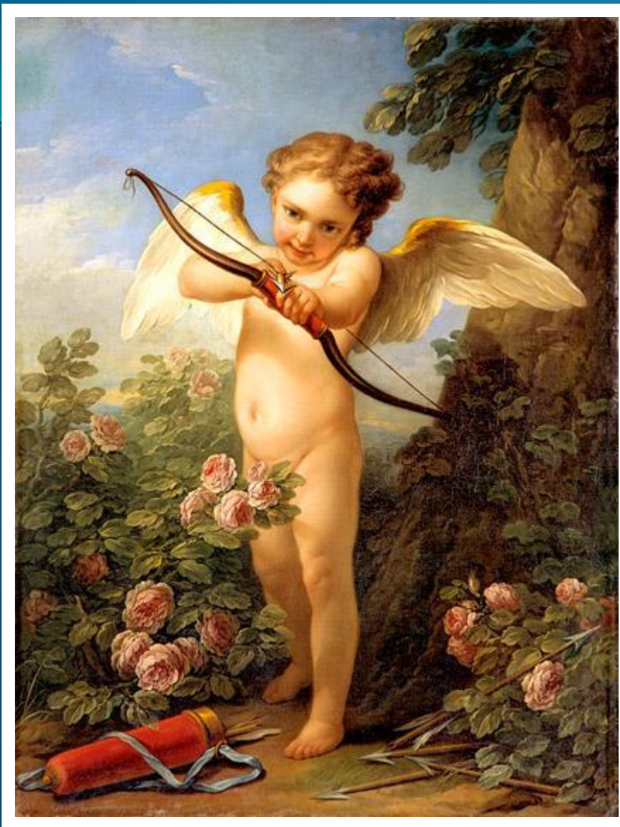
Амур, стреляющий из лука - Ванлоо Карл