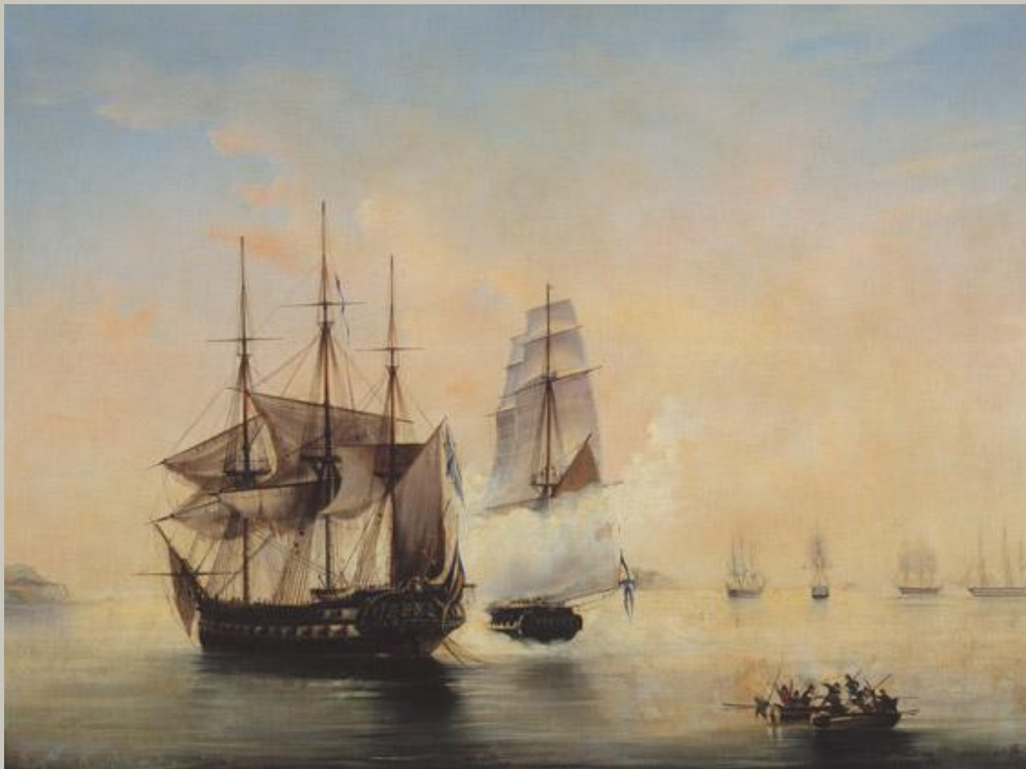
Взятие шведского фрегата «Венус» 21 мая 1789 года - Боголюбов Алексей