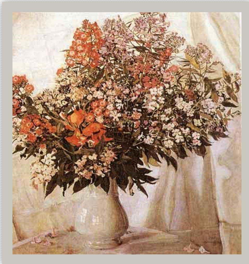
А.Головин. Натюрморт. Цветы в вазе.