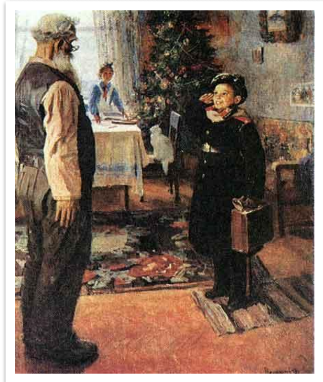
Ф. Решетников. Прибыл на каникулы.