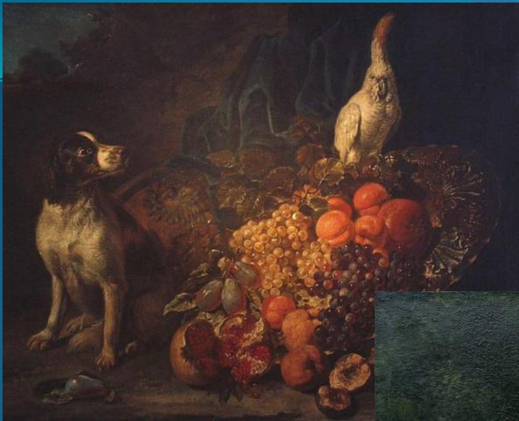
Давид Конинк. Картина "Натюрморт с собакой и попугаем".