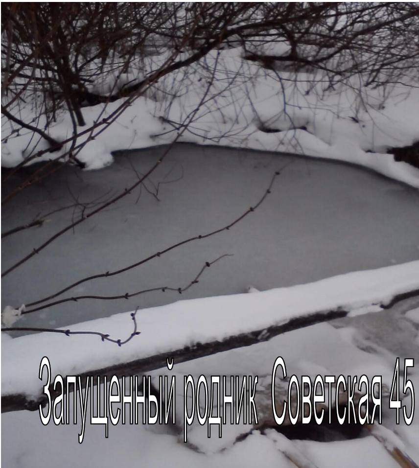
Запущенный родник Советская 45