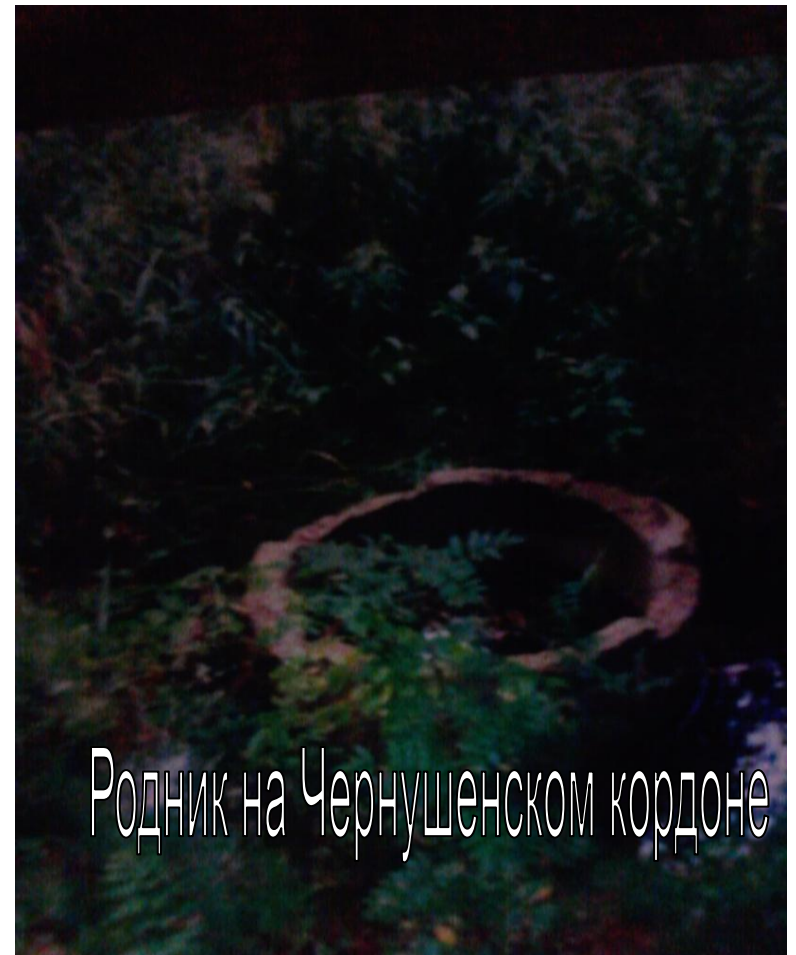
Родник на Чернушенском кордоне