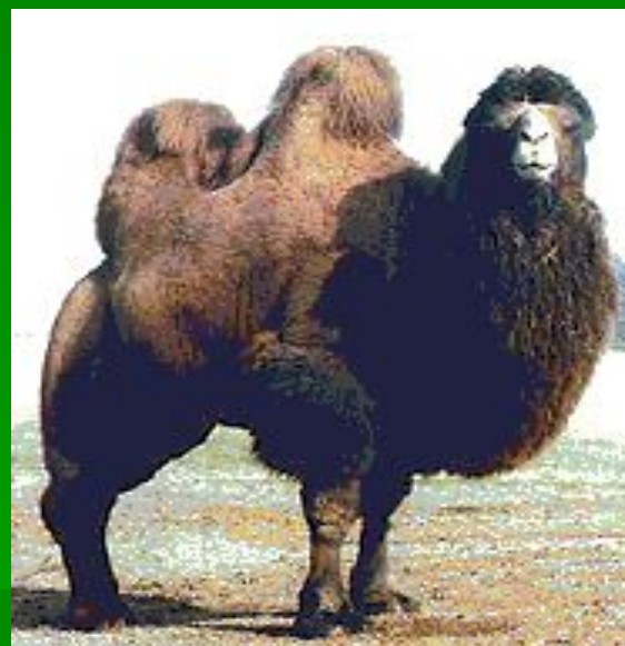
Бактриан (двугорбый верблюд)