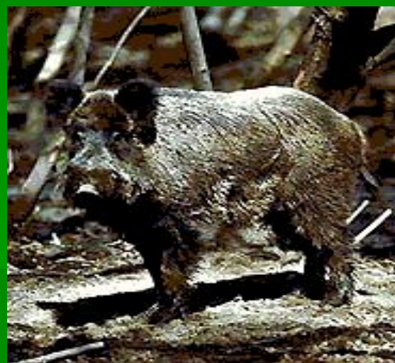
Кабан ( нежвачный )