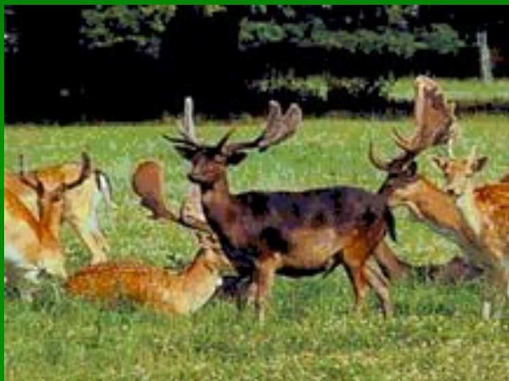
Лани ( жвачное )