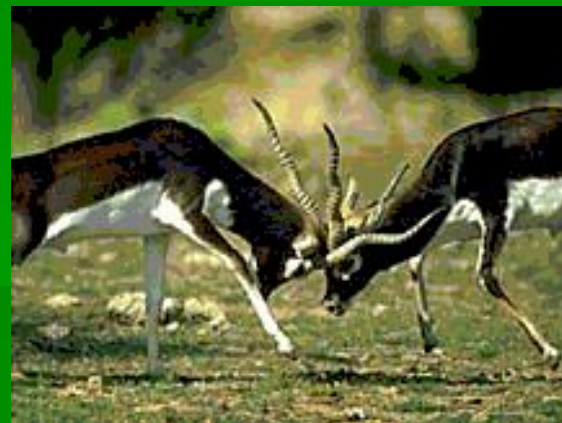
Гарна ( жвачное )