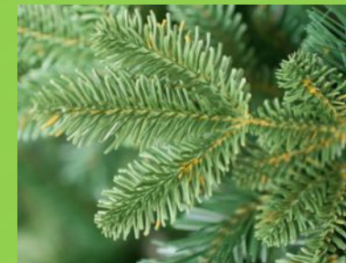
Хвоя пихты и кедра