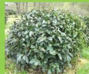
Листья, стебли растений