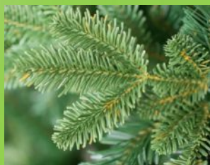
Хвоя сосны и ели