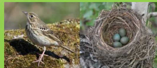
Птицы и их яйца