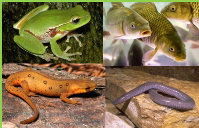
Рыбы и земноводные