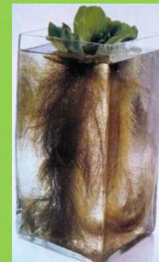
Корни водных растений