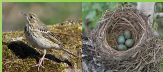
Птицы и их яйца