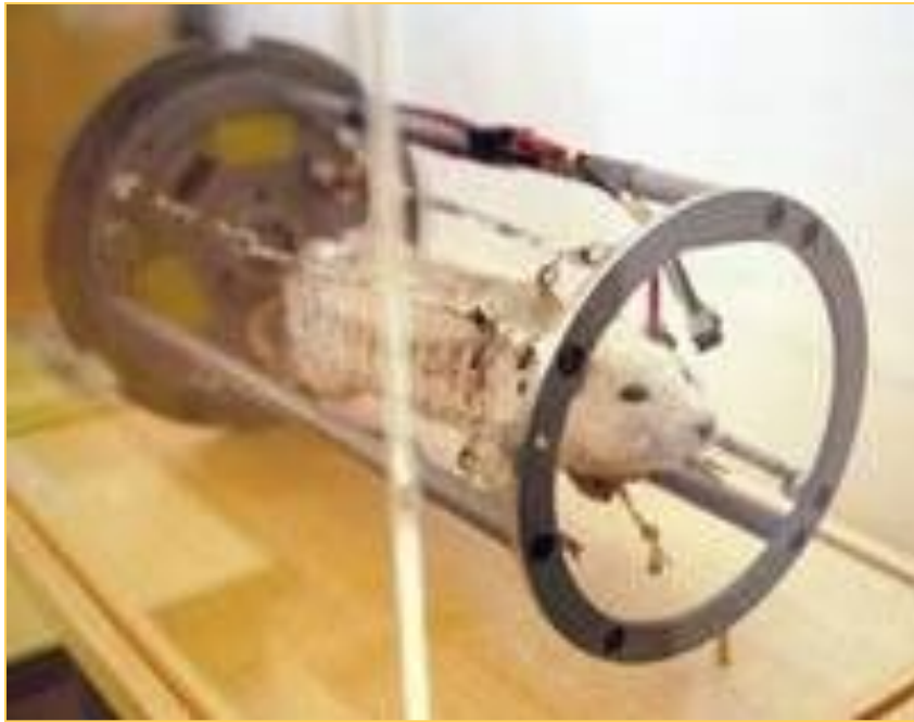
Крыса Гектор в контейнере