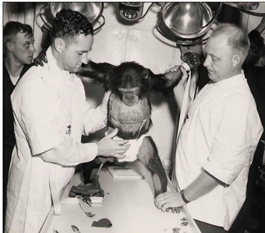
Сэм на послеполётном обследовании

Обезьяны тоже побывали в космосе. В США первоначально запускали обезьяну в космос. Россия тоже запускала обезьян. Всего в космос летали 32 обезьяны. Это были макаки и шимпанзе.