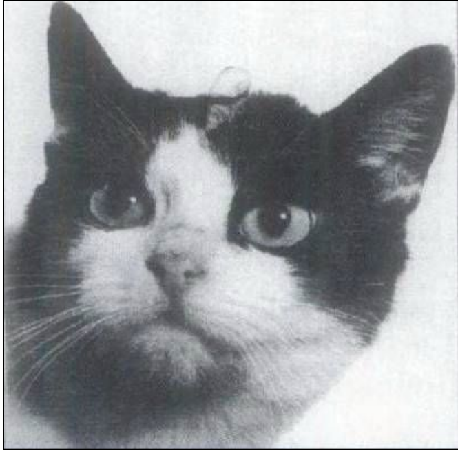
Знаменитая Фелисетт, первая в мире космическая кошка

В 1963 году Франция запустила в околоземное пространство ракету с кошкой на борту. В подготовке к этому полёту принимало участие 12 ЖИВОТНЫХ.