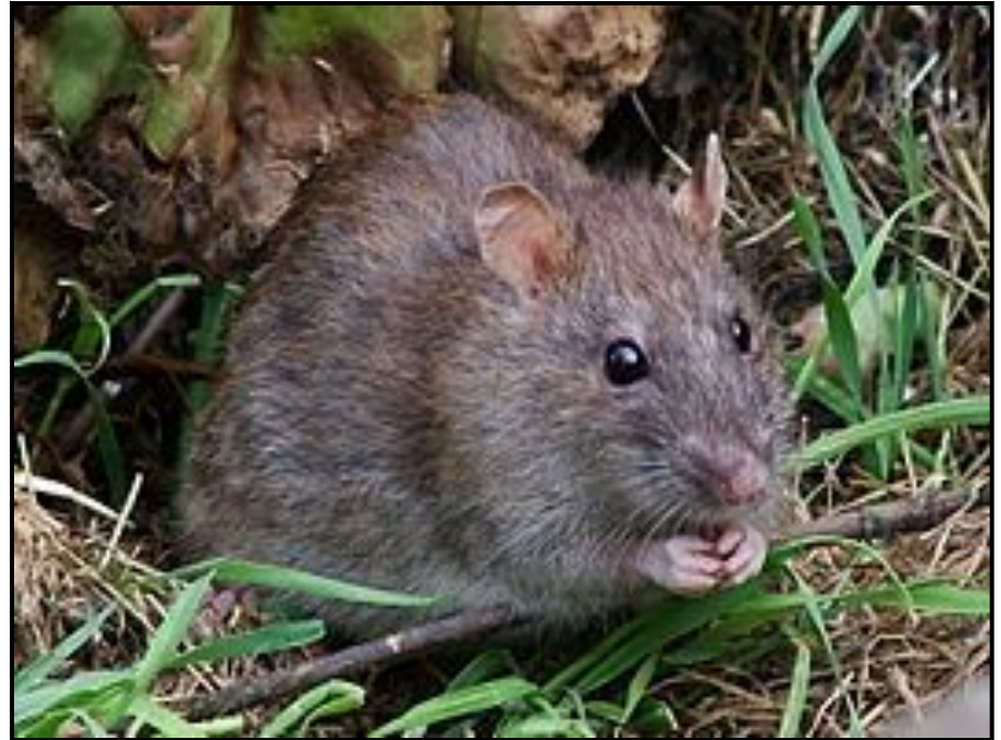
Без крыс в космосе никак