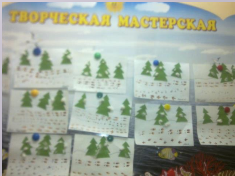
Дикие животные и их следы:

а — волка, б — кабана, в — медведя, г — лося