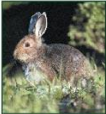
Карта «В лесу»