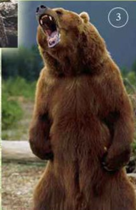
1.Лось 2.Кабарга 3.Бурый медведь 4.Рысь 5.Соболь 6.Бурундук 7.Глухарь 8.Клест