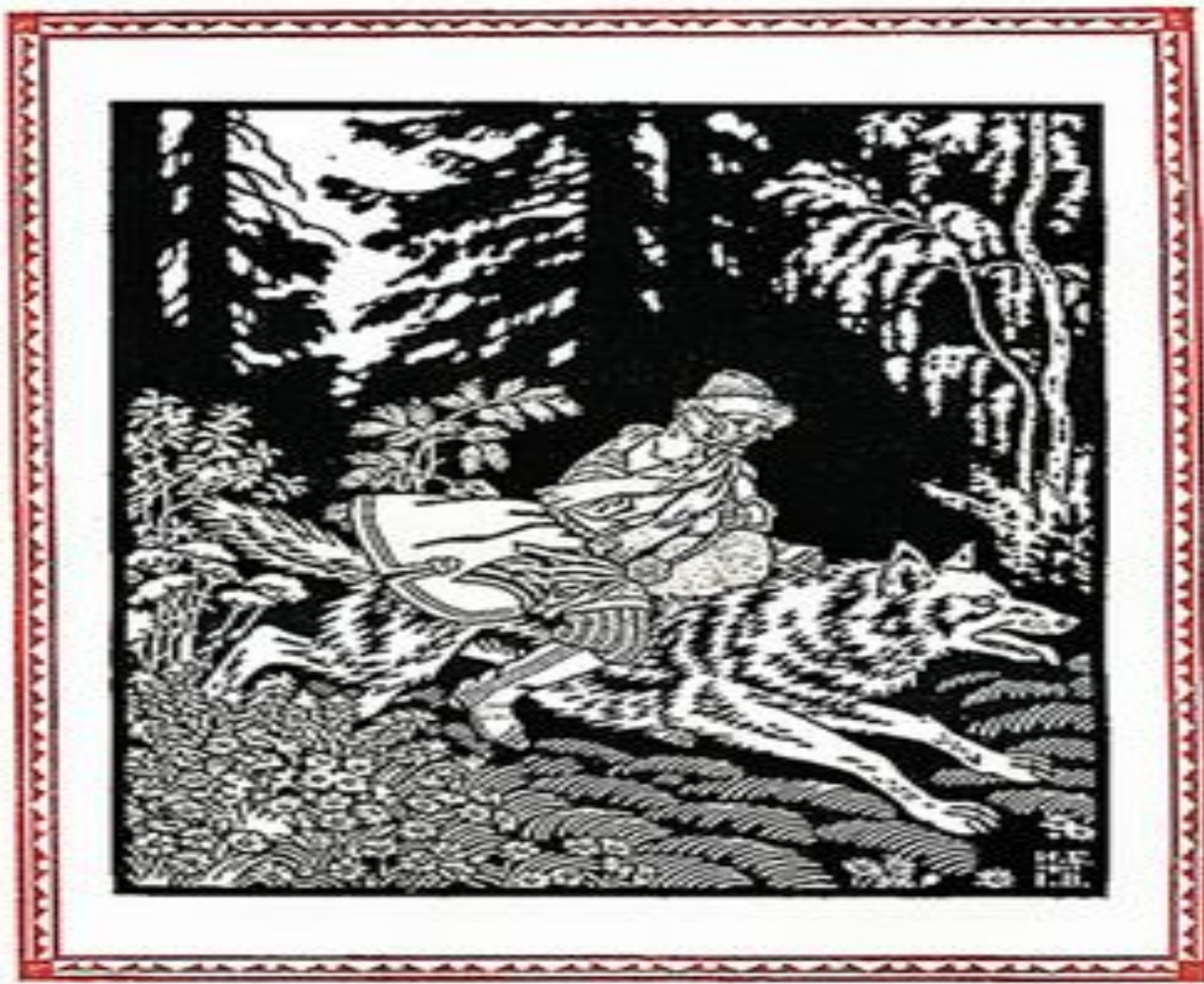
И.Я. Билибин. Иллюстрация к « Сказке об Иване- царевиче, жар-птице и сером волке»