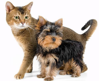
Кошки и собаки