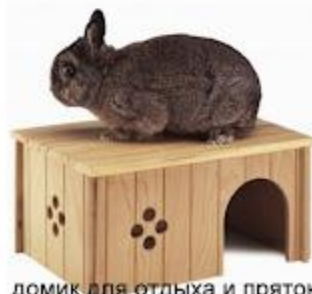
домик для отдыха и прятков