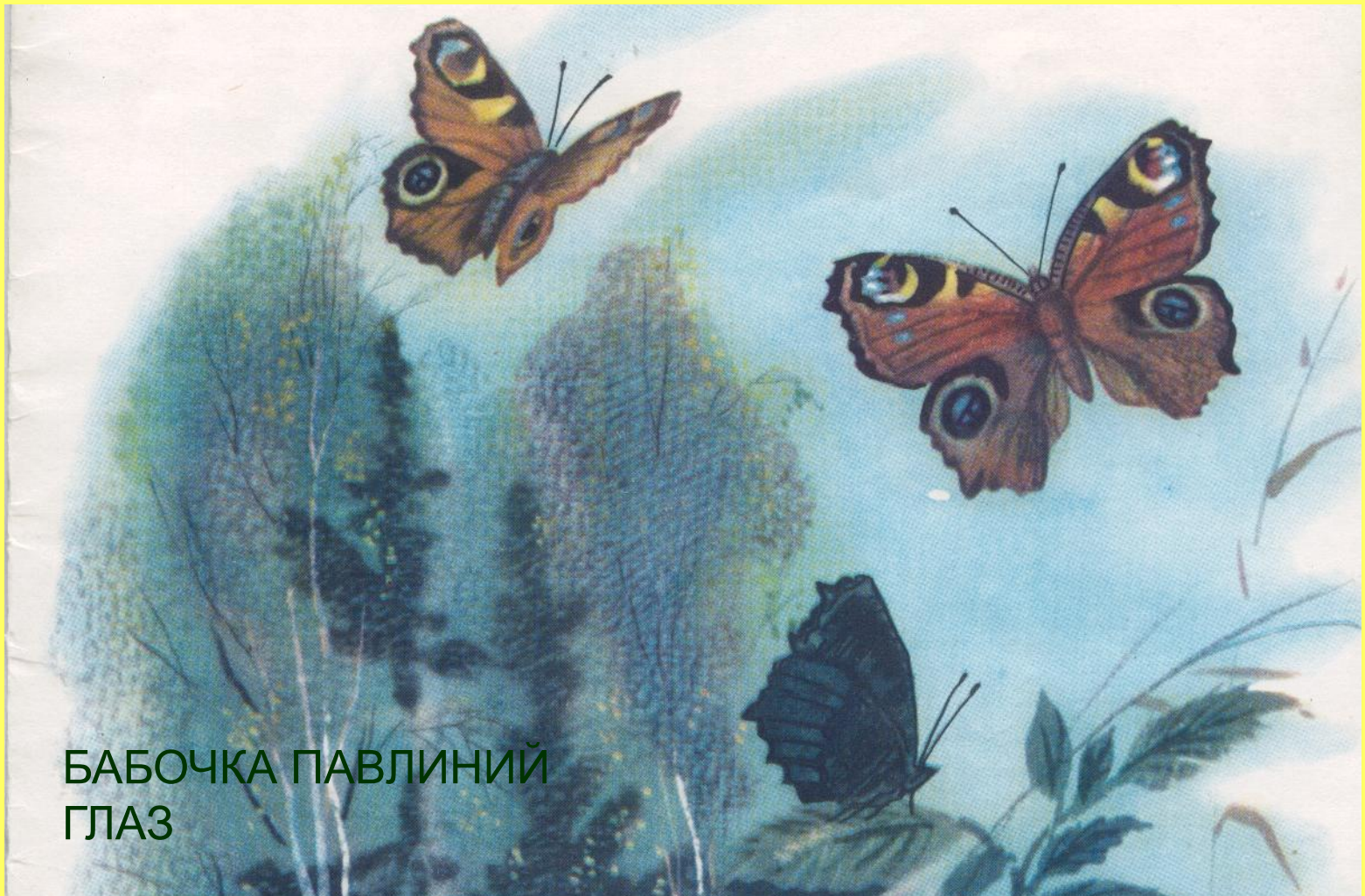
БАБОЧКА ПАВЛИНИЙ ГЛАЗ

Сложит она крылышки- её и не видно, потому что с обратной стороны они у неё тёмные. Но если распахнёт – так и сверкнут голубые «очи».