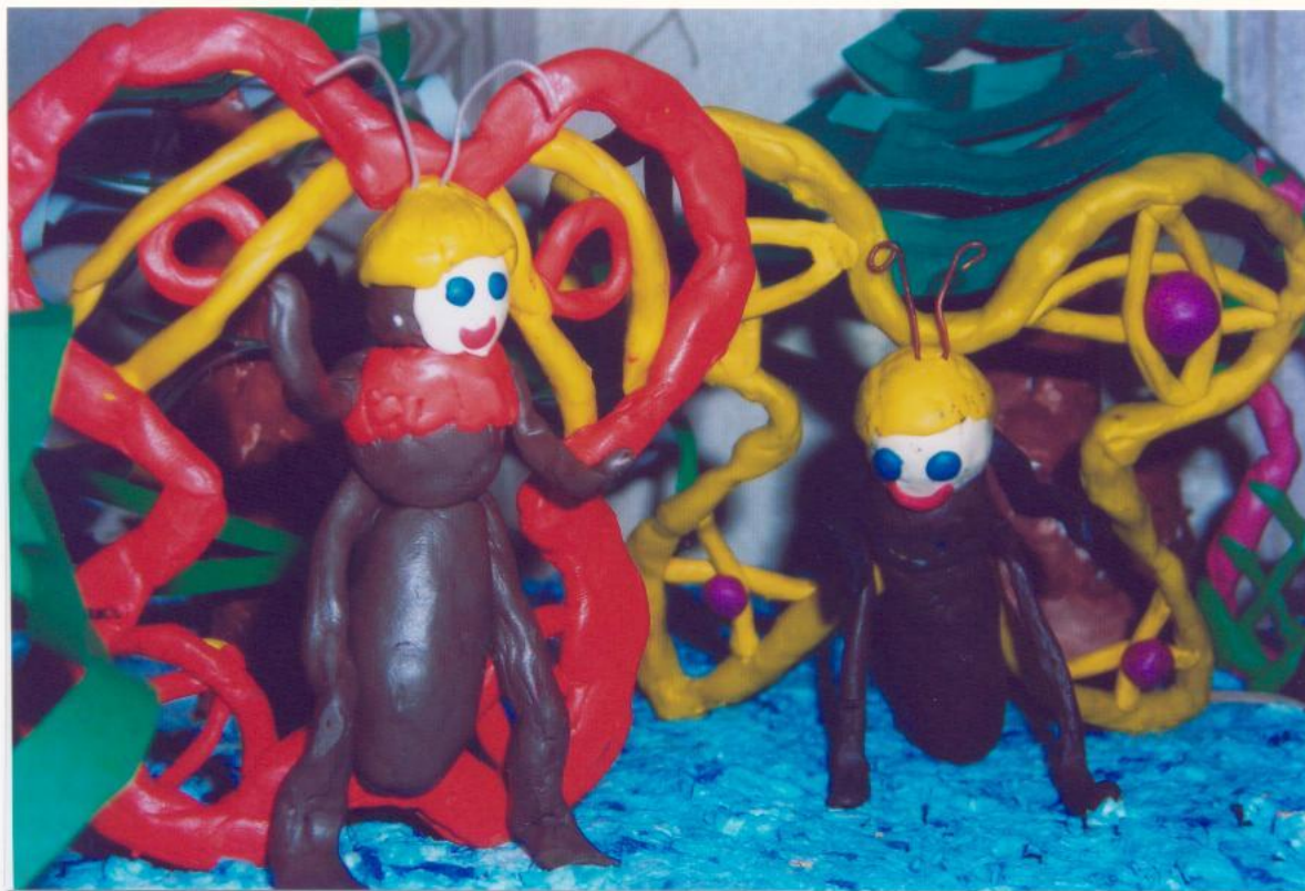
ТАНЦУЮЩИЙ МОТЫЛЁК. Пластилин на каркасе.