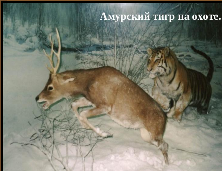
Амурский тигр на охоте.