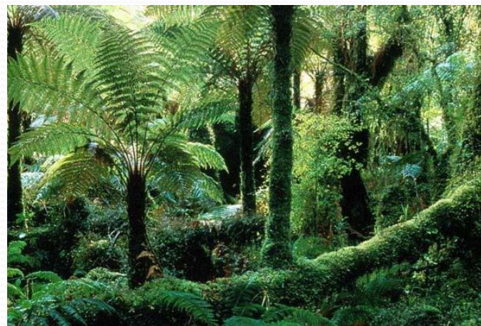
2. влажный тропический лес