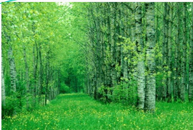
1. лиственный лес