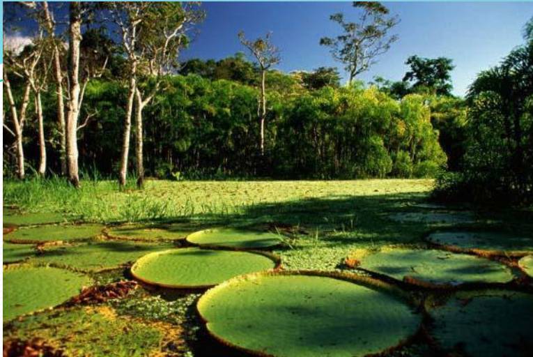
1. Южная Америка