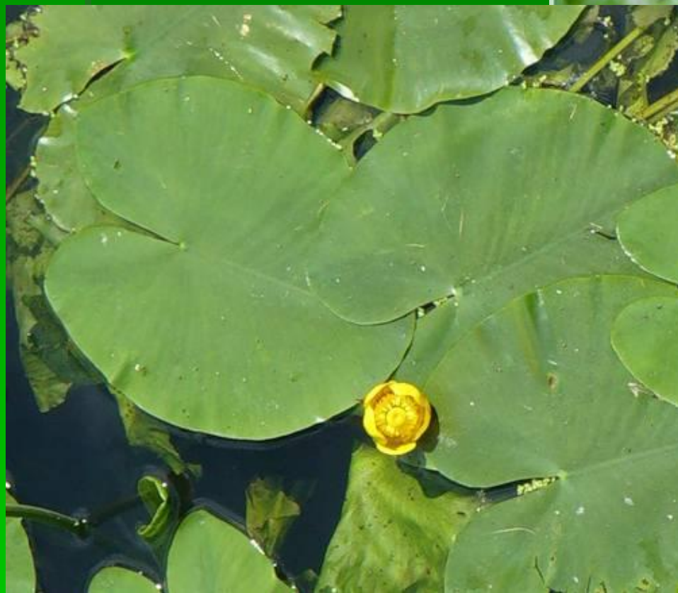
Кубышка (жёлтая кувшинка)