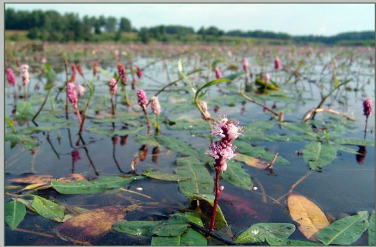
Горец (срежика земноводная) - Жолудчатая спррідитна Л., Листовіе водорослище