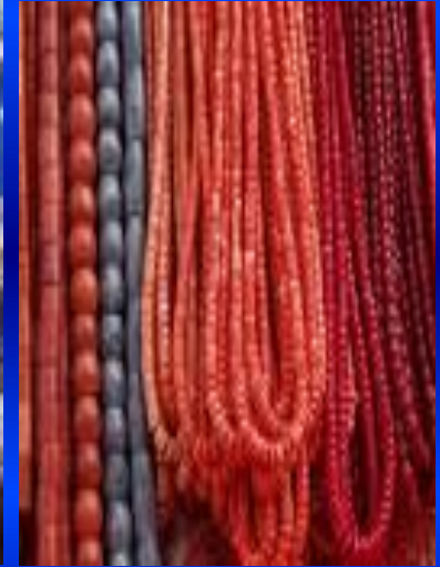
Кораллы и изделия из них