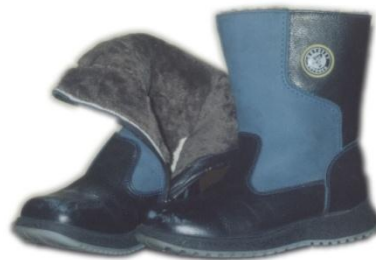
САПОГИ НА МЕХУ