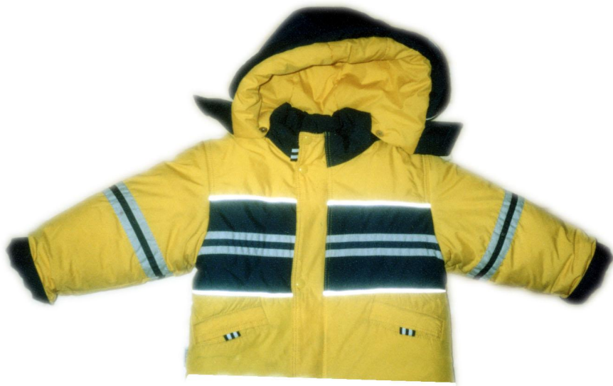
КУРТКА НА МЕХУ ИЛИ ПУХОВИК