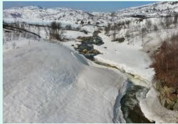
2. Земля покрыта снежным покровом.