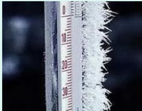
4. Низкие температуры, ( морозы ).