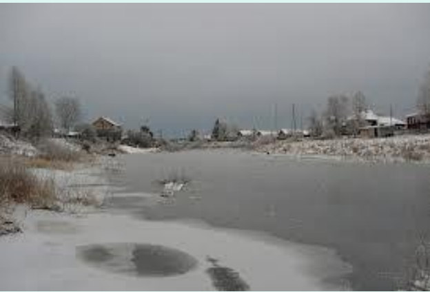
1. Появляется лёд на прудах, озёрах