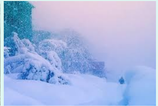
3. Метели, снегопад.