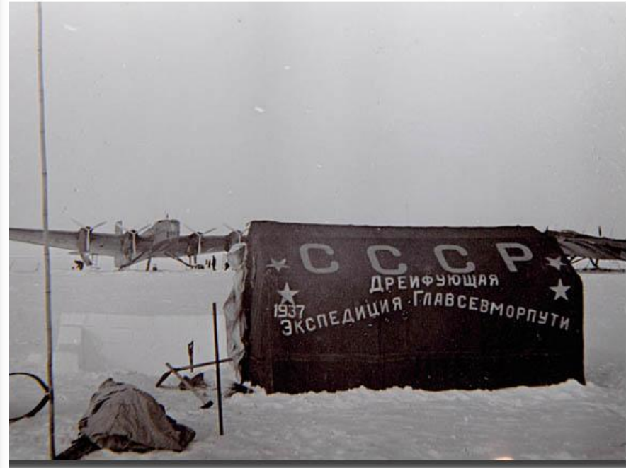
Папанин на дрейфующей льдине в 1937 году