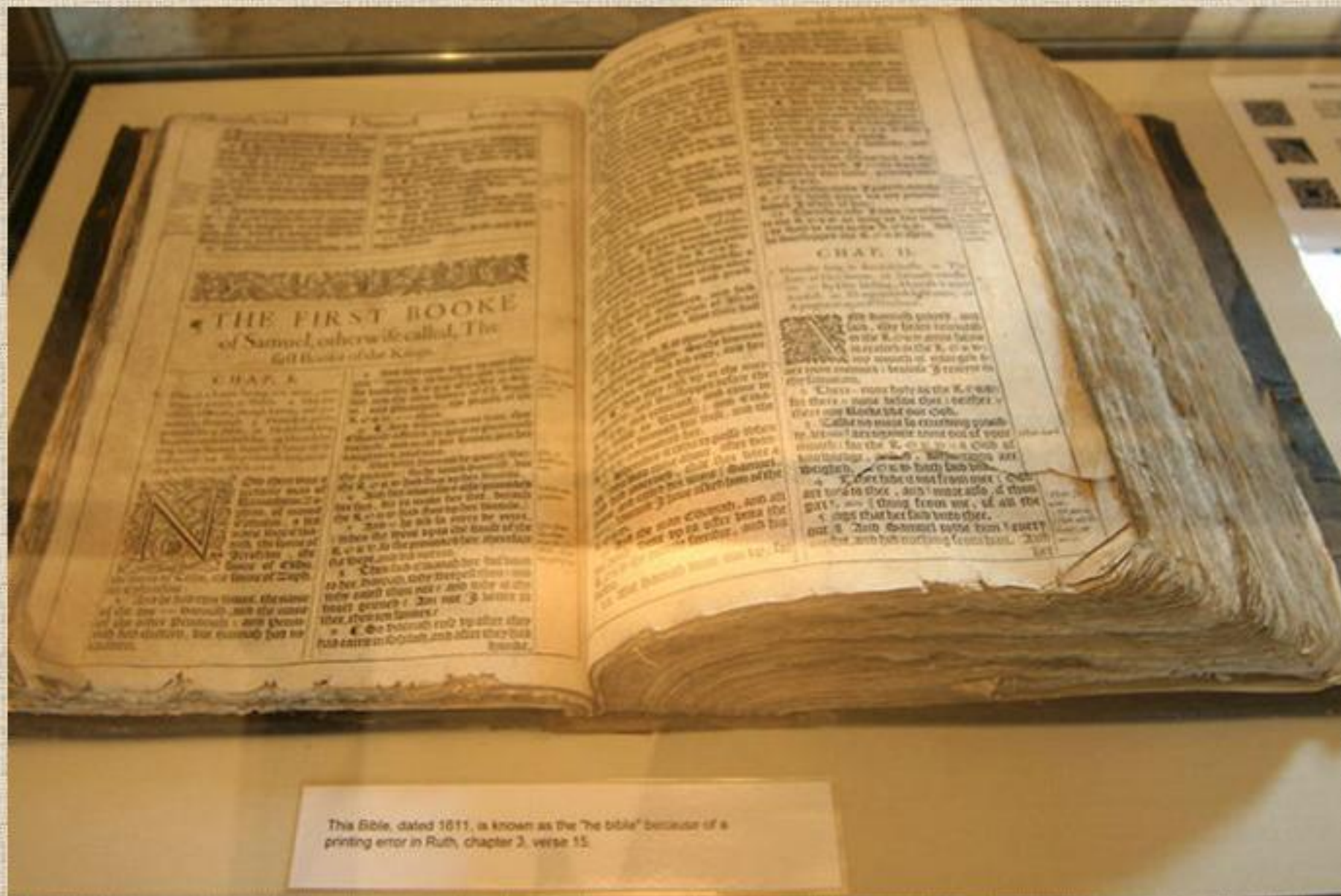
This Bible, dated 1611, is known as the "be bible" because of a printing error in Ruth, chapter 3, verse 15.

События эти записаны в древней книге, которая называется Библия