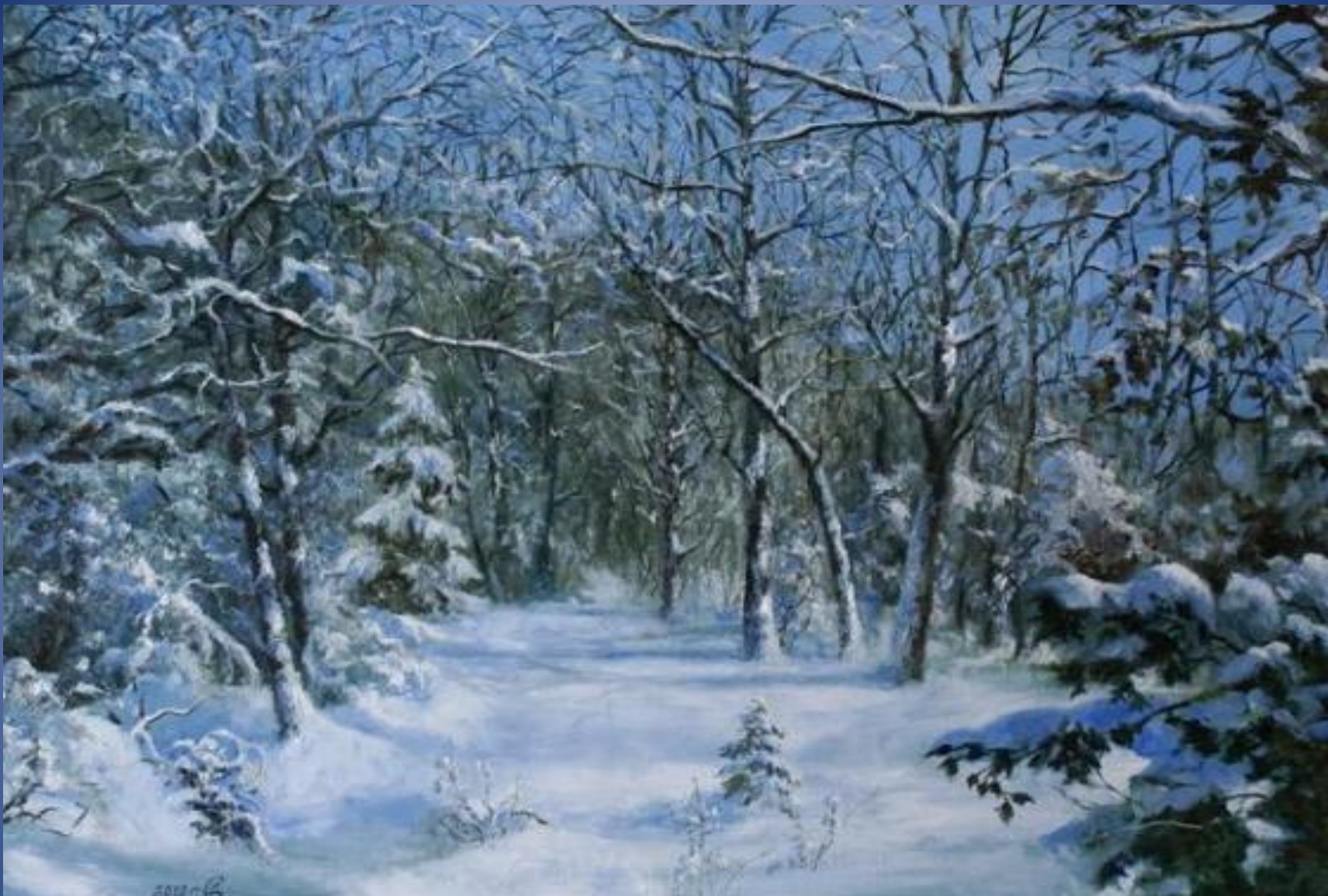
К. Ф. Юон «Зима»