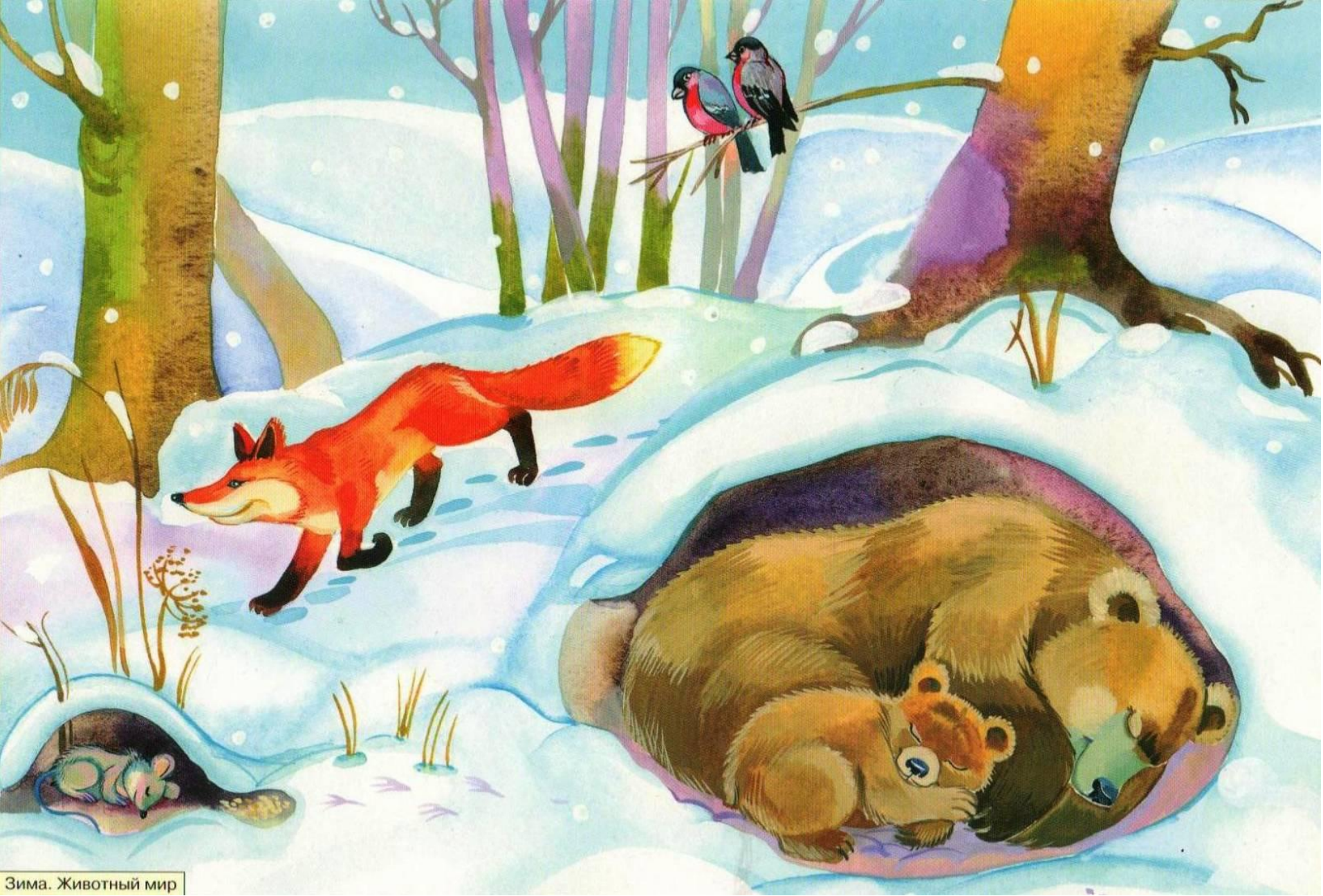
Зима. Животный мир