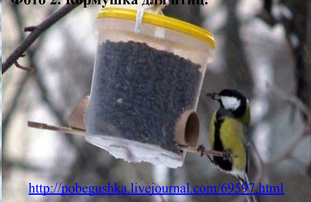
Фото 2. Кормушка для птиц.

http://pobegushka.livejournal.com/69597.html