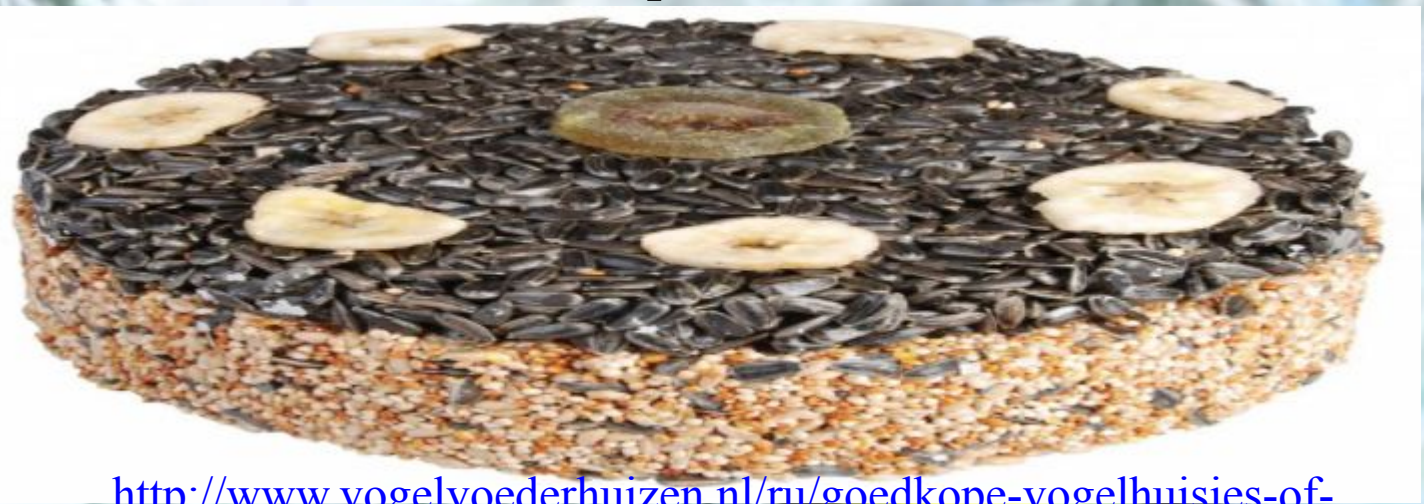
Фото 4. Торт для птиц.

http://www.vogelvoederhuizen.nl/ru/goedkope-vogelhuisjes-of-vogelvoeders-kopen-1399056.html