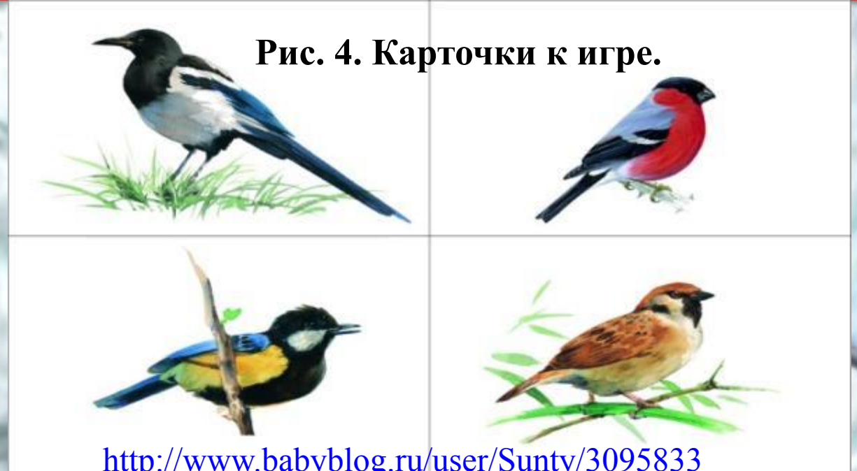
Рис. 4. Карточки к игре.

http://www.babyblog.ru/user/Suntv/3095833