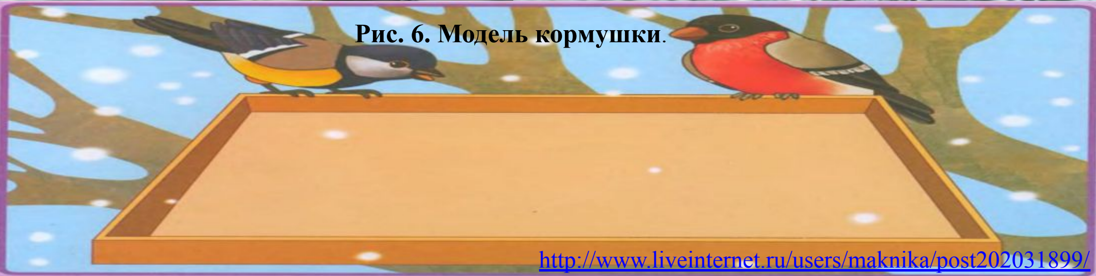
Рис. 6. Модель кормушки.