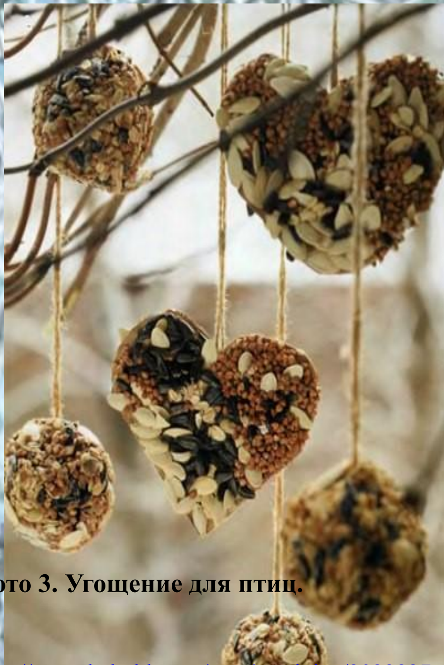
Фото 3. Угощение для птиц.

http://www.babyblog.ru/user/osminina/3023937