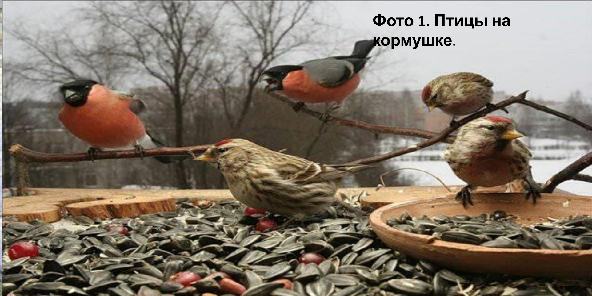
Фото 1. Птицы на кормушке.