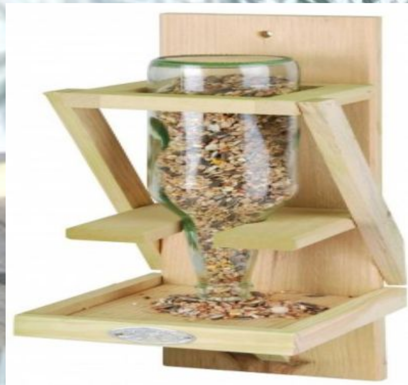
Фото 5. Кормушка из бутылки для птиц.

http://www.vogelvoederhuizen.nl/ru/goedkope-vogelhuisjes-of-vogelvoeders-kopen-1399056.html