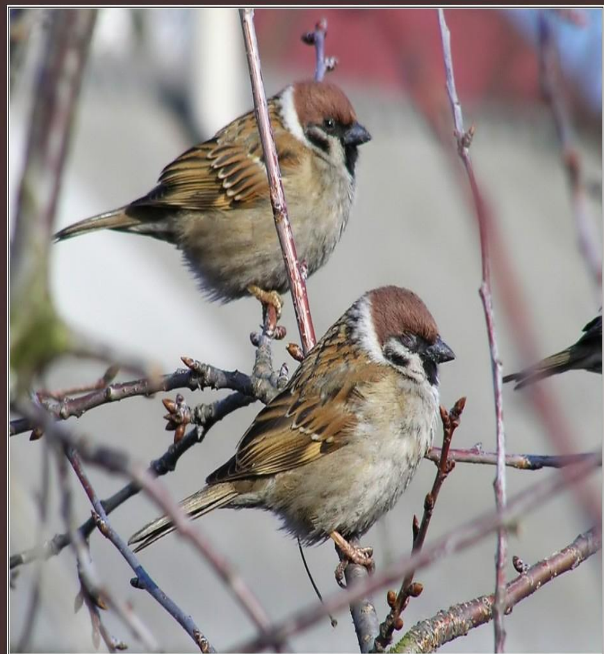
Воробьи полевые ( Passer montanus ) ♂ ♂