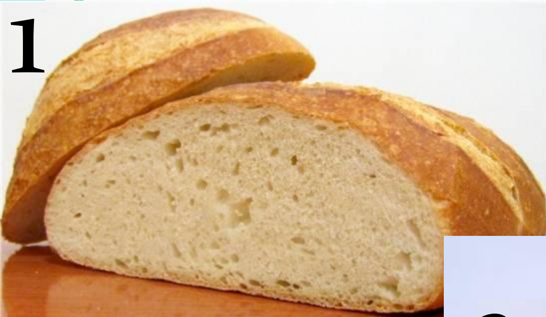
1-хлеб из пшеничных колосков