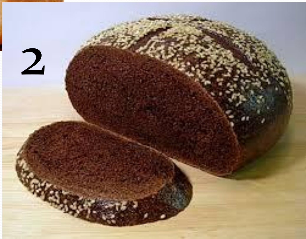
2-хлеб из ржаных колосков