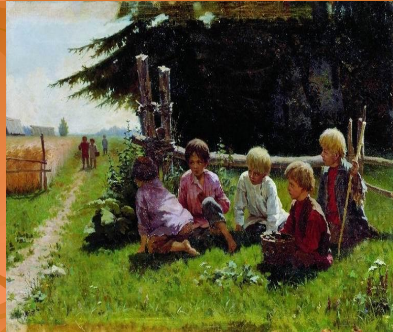
И. М. Прянишников «В засаде»

Жребий в игровой традиции выполняет функцию высшей справедливости. Его решению при распределении игровых ролей все обязаны подчиняться беспрекословно. Обычно жеребьевка предназначена для тех игр, в которых предусмотрено две команды. Из числа самых ловких игроков выбираются два капитана, затем ребята, примерно равные по силам и возрасту, отходят парами в сторону, сговариваются и, договорившись, подходят к капитанам