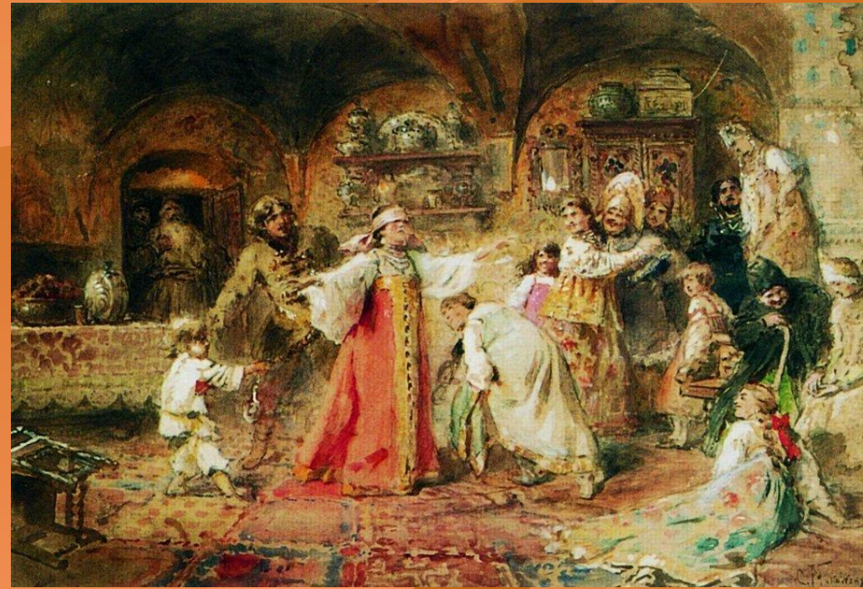
К. Е. Маковский «Прятки»

Своеобразные диалоги-приговорки в играх могли быть довольно длинными и забавными. Причем менять по ходу игры фразы в них не возбранялось. Наоборот, это добавляло игре интереса и живости.