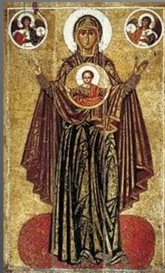
«Ярославская Оранта» — икона времён Константина Всеволодовича из Спасского монастыря

Первые каменные постройки в Ярославле появились незадолго до монгольского нашествия, в 1210-е годы, по воле старшего сына Всеволода Большое Гнездо — Константина[38]. Он основал в стенах Спасского монастыря первое на территории Северо-Восточной Руси учебное заведение — Григорьевский затвор[39], возвёл в этой обители две церкви — соборную и Входаиерусалимскую, отстроил в камне Успенский собор[38]. Судя по сохранившимся под современным зданием Входаиерусалимской церкви нескольким метрам домонгольской кладки, Константин, в отличие от отца и деда, заказывал постройки не белокаменные, а кирпичные, украшая их белокаменными деталями[38].